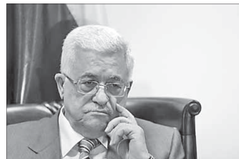
Президент ПА Махмуд Аббас

(См. статью «Погром посольства в Каире — взгляд изнутри» на 4-й стр.)