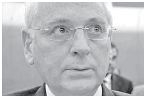
Посол Израиля в Египте Ицхак Леванон