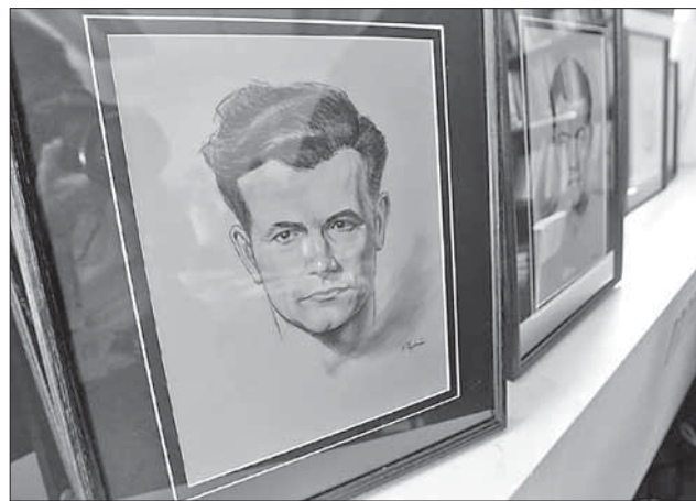
Один из портретов из экспозиции выставки в «Яд ваШеме»

герею команду из 140 человек, в которую вошли талантливые художники, граверы и печатники. Под тайное производство были выделены два специальных барака, получившие название «Блок-19». Участникам «проекта» были созданы лучшие условия, чем у обычных заключенных.