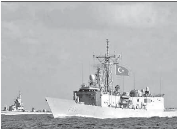
Турецкие военные корабли в Средиземном море

но в первую очередь экономическими причинами и связана с разработкой недавно открытых нефтяных и газовых месторождений в Средиземном море. Недавно стало известно, что турецкие власти запрещают Кипру заниматься разведывательными работами в его территориальных водах — эти работы собирались вести американская компания «Noble Energy» и израильская «Делек». Как известно, Турция не признает средиземноморских соглашений о границах экономи-