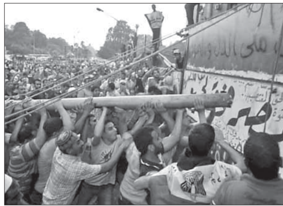
Демонстранты штурмуют израильское посольство в Каире

го совета Египта, который управляет страной. Манифестанты выступили с обвинениями в адрес главы военного совета, генерала Тантауи, который, по их словам, «защищает