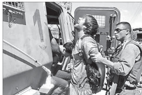
Солдаты ЦАГАЛа задержали подозреваемых

Ранее сообщалось, что после нападения на посольство Израиль в Египте вылета в аэропорту Каира ждут посол и члены его семьи, а также сотрудники израильской дипмиссии. В Израиль, по словам сотрудников каирского аэропорта, дипломатов должен был доставить военный самолет. Египетское гостелевидение сообщило, что после нападения демонстрантов на посольство Леванон встречался с генера-