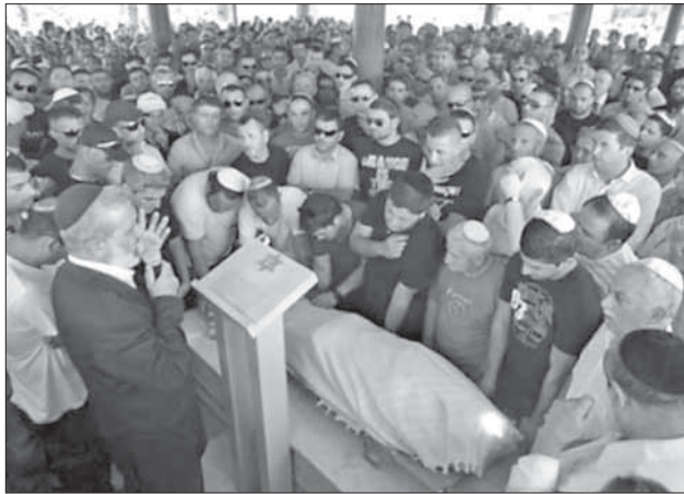
Похороны очередной жертвы хамасовских ракетчиков

между ХАМАСом и ФАТХом (или ХАМАСом и Израилем, как в деле Гилада Шалита), отношения к палестинским исламистам там остаются настороженным. В Каире и после Тахрира многие недовольны усилением «Братев-мусульман», единомышленников ХАМАСа, и опасаются беспорядков на границе с Газой. Неслучайно египетские власти, обвиняя Израиль в гибели своих пограничников, одновременно сотрудничают с Иерусалимом в попытках остановить эскалацию насилия в регионе. А к ХАМАСу у Египта особые счеты: когда палестинские боевики совершили налет на полицейский участок в Эль-Арише на Северном Синае и скрылись в Газе, правительство Исмаила Хании налетчиков не выдало. Каир вынужден был провести в Синае военную операцию,