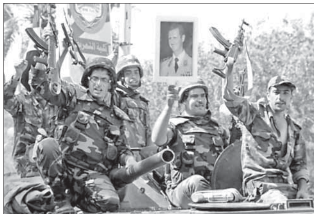
Солдаты из верных Асаду частей пытаются создать видимость того, что ситуация находится под контролем властей

ООН Пан Ги Муна с Башаром Асадом, который состоялся в среду, 17 августа. Ранее