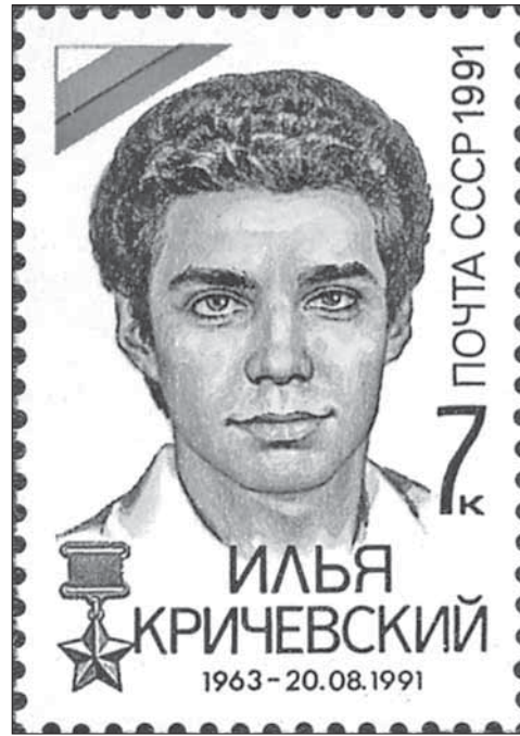
Почтовая марка с портретом И. Кричевского

каждый год в ночь с 20-го на 21 августа спускается в туннель, где погиб его сын. «Если в первые годы там собиралось много народа, то в последние годы — считанные единицы. Это естественный процесс. С годами накапли-