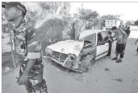
Машина террористов после израильского авиаудара

не всех массовых мероприятий на юге страны, в том числе, концертов и футбольных матчей.