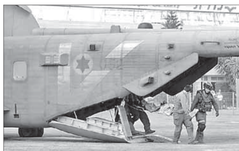
Раненых в терактах под Эйлатом вертолетами эвакуировали в больницы города Беер-Шева

ВВС Израиля нанесли вечером 18 августа авиаудары по сектору Газа, сообщает агентство «Франс пресс». По сло-