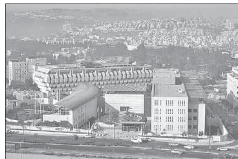
Здание МИД Израиля в Иерусалиме

Каждый из руководителей израильских дипмиссий должен в кратчайшие сроки представить в МИД свой план работы в этом направлении. «Этот план должен включать в себя переговоры с самыми высокопоставленными политиками, мобилизацию всех возможных сил (местные еврейские диаспоры, неправительственные организации), использование СМИ, влияние на общественное мнение и публичную дипломатию, нацеленную на жителей страны пребывания», — пояснили в МИДе.