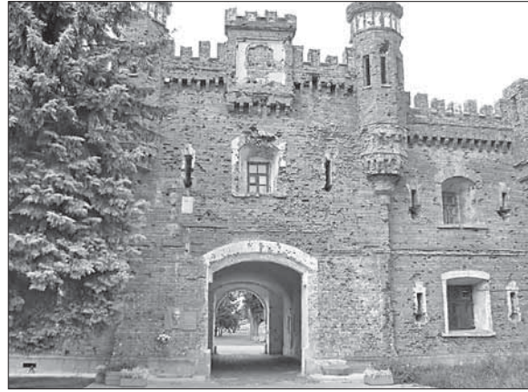
Холмские ворота крепости, рядом с которыми был расстрелян Е. Фомин. Слева от ворот видна мемориальная доска

Полковой комиссар Ефим Фомин — личность легендарная. В 2009 году в ки-