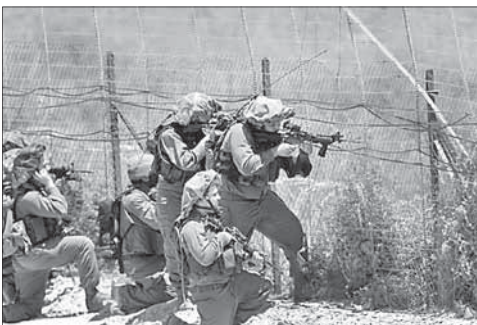
Солдаты ЦАГАЛа на израильско-сирийской границе

Источник отметил, что посредничество Египта будет основано на ранее согласованных между Израилем и ХАМАСом пунктах. «В настоящее время мы изучаем позицию каж-