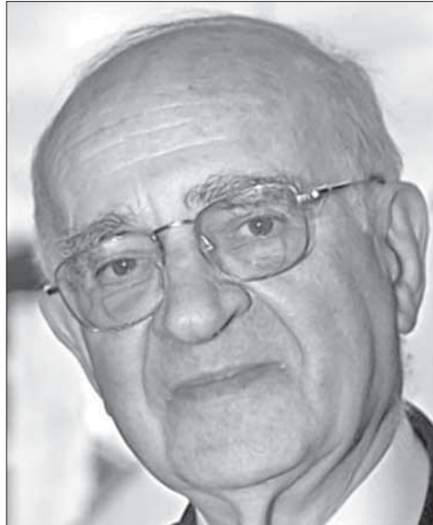
Митек Пемпер. Фото 2006 г.

стать для него последним. Гауптштурмфюрер обладал неуравновешенным характером и отличался садистскими наклонностями. Он неоднократно ради забавы сам расправлялся с заключенными, причем делал это с особой жестокостью.