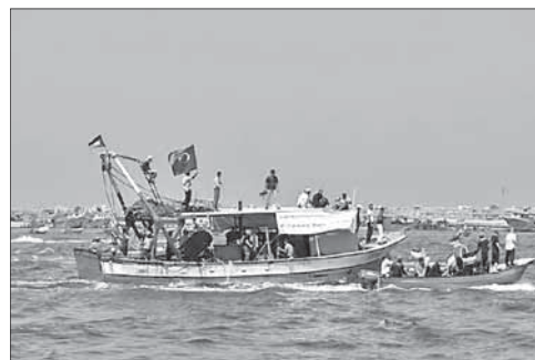
Очередная «флотилия» направляется к Газе

Восстание в Сирии началось в марте 2011 года с требований повысить уровень жизни населения и провести либерализацию политической системы. После того, как правительство применило против демонстрантов силу, требования изменились: люди вышли на улицы под лозунгами о смене действующе-