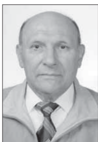
Автор-составитель Наум Гержой