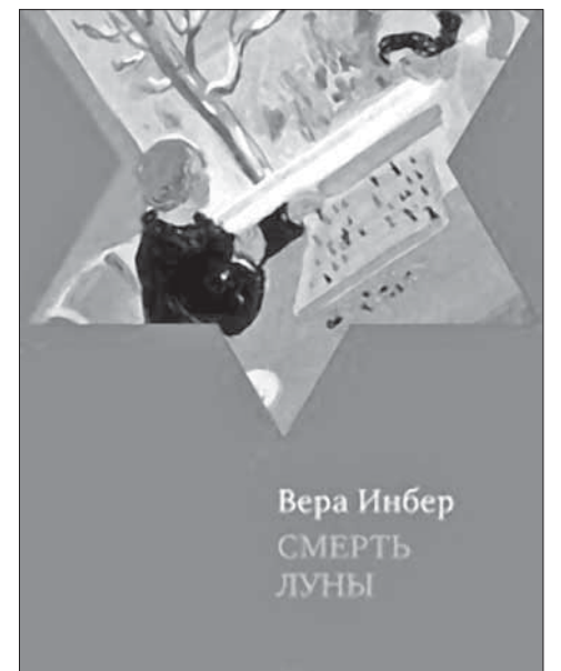
Вера Инбер СМЕРТЬ ЛУНЫ

Инбер пережила своего двоюродного брата Льва Троцкого (он жил в доме ее родителей, будучи еще никому не известным Лейбой Бронштейном; Инбер писала ему стихи, бывала в Кремле, когда Лейба превратился во Льва). После убийства Троцкого она всю жизнь боялась за себя и родных. Боялась — и пережила собственного внука больше чем на полвека (мальчик умер в блокадном Ленинграде), дочь — на десять лет, Сталина — почти на двадцать. На фотографиях у нее до самой старости испуганные глаза... Но в рассказах из сборника «Смерть Луны» можно увидеть другую Инбер — юную, легкую, пока еще без позорного прошлого, пока еще с неведомым