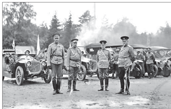
На старте автопробега

√Стартовал большой международный пробег грузовых автомобилей на дистанцию «Петербург — Москва» и обратно, организованный военным ведомством. В пробеге участвуют 16 грузовых автомобилей различных заграничных