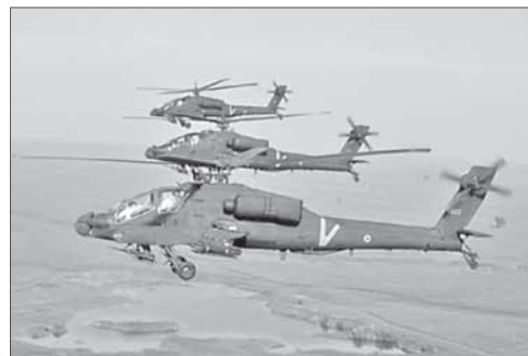
Боевые вертолеты израильских ВВС

В рамках соглашения, подписанного еще в ноябре прошлого года между министерством обороны и министерством межрегионального сотрудничества, на территории Иудеи и Самарии должны были быть построены диспетчерские центры с современным оборудованием. Но