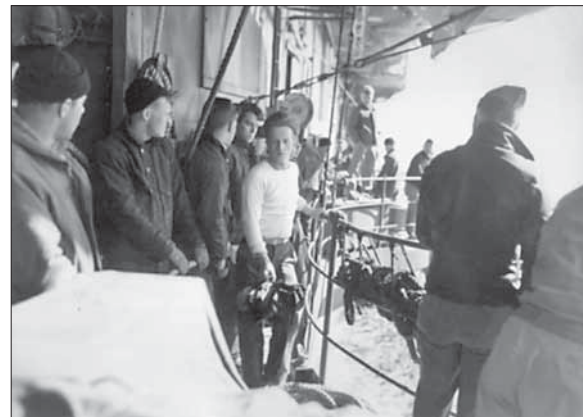
Пленные немецкие подводники на борту американского эсминца

Казалось бы, нацистская пропаганда одержала крупную психологическую побе-