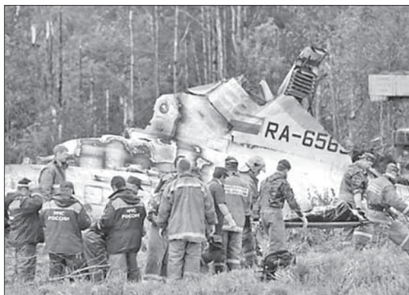
Спасатели на месте падения Ту-134

Как установили эксперты Межгосударственного авиационного комитета, крушение Ту-134 не связано с отказом в системах лайнера, и его двигатели работали до момента падения. «Информации от экипажа и по запи-