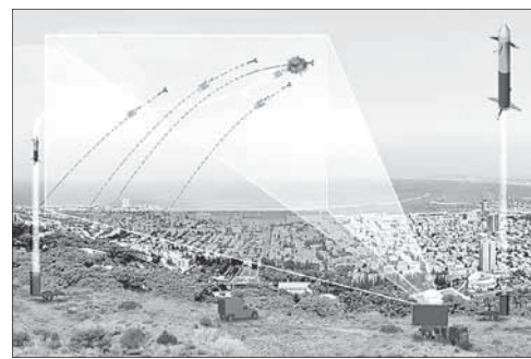
Схема действия системы «Железный купол»

По этой причине ВВС Израиля пришли к выводу, что будет дешевле и эффективнее перевести «Железный купол» в резерв и использовать его либо в случае экстренной необходимости, например, ожидающегося массового обстрела тер-