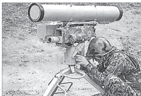
Противотанковый ракетный комплекс «Корнет»

Как рассказал Ашкенази, ракета была выпущена по израильскому танку 6 декабря, она пробила броню, но не взорвалась. Пострадавших в результате этого инцидента не было. По словам начальника Генштаба, подобные ракеты ранее применялись против израильской армии во время войны в Ливане в 2006 году и представляют большую опасность.