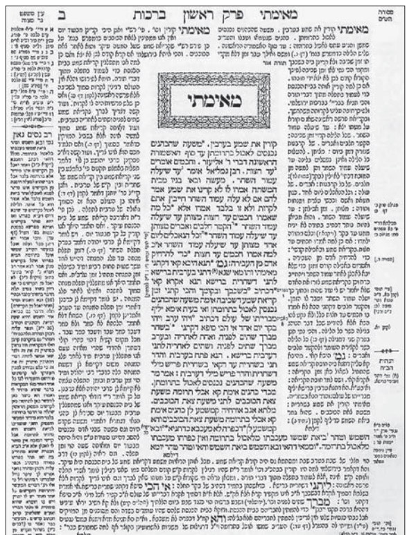
Лист Вавилонского Талмуда

ромагнитных явлений, атомно-молекулярной теории, кинетической теории материи, или единой системы права, некоторой философской системы и т. п.); при этом создание такой теории опирается на результаты детального исследования отдельных эффектов, объектов или явлений и их объяснений со скоординированным выявлением присущих им противоречий и преодолением последних, а также на выявлении присущих им общих признаков, свойств и характеристик.