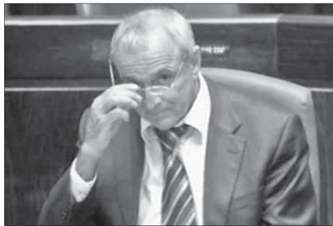
Министр Ицхак Аронович

Министр подчеркнул, что ни одно государство не потерпело бы регулярного обстрела своей территории. По словам Ароновича, всю полноту ответственности за происходящее несет ХАМАС, захвативший власть в Газе и контролирующий сектор. «Его руководство должно знать, что расплата за происходящее неизбежна», — добавил министр.