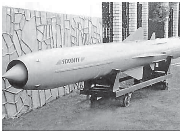
Крылатая ракета П-800 «Яхонт»

Израиль и Соединенные Штаты в прошлом неоднократно обращались к России, требуя разорвать контракт на поставку оружия Сирии, указывая, что переданные ей ракеты рано или поздно оказываются в распоряжении «Хизбаллы» и