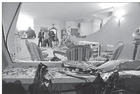
Разрушенный взрывом дом в Беер-Шеве