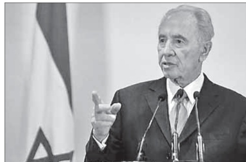
Ш. Перес отвечает на вопросы журналистов

Перес возложил большие надежды на новое поколение арабских народов: «Были времена, когда арабы находились на острие прогресса. Они могут вернуться — все зависит только от них». Ветеран израильской политики также выразил несокрушимую веру в то, что «ислам полностью совместим с принципами современной демократии», и попросил Запад помочь арабам материально.