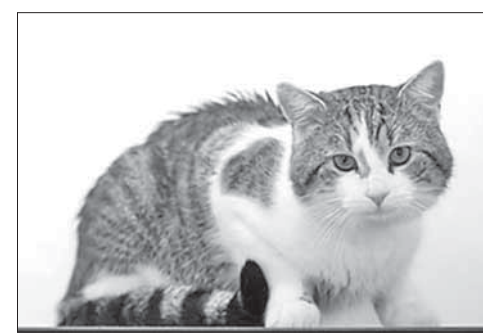
Кот Ларри (или Джо?)

Как на Даунинг-стрит, 10, отреагировали на заявления Сатклиффов, не сообщается.