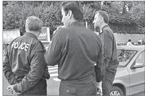
Полиция на месте одного из взрывов в Тегеране

Израильская компания EarlySense стала лауреатом традиционной ежегодной премии What's New, вручаемой одним из самых читаемых научных журналов в мире Popular Science