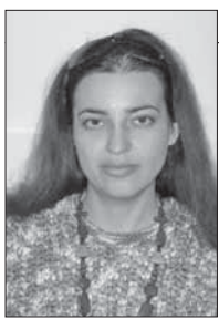
Подготовила Наталья Дегтева

«Ведомости Одесского градоначальства», 30 ноября 1910 г.