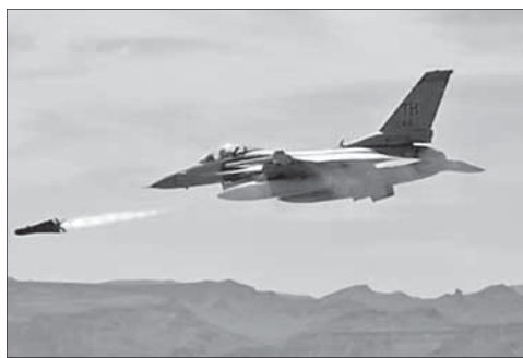
Израильский самолет производит пуск ракеты

Обсуждение было длительным и бурным. Правительственная коалиция прилагала неимоверные усилия, чтобы заручиться поддержкой 61 депутата. В результате за принятие закона проголосовали 65 депутатов, против — 33.