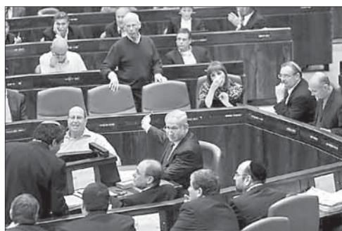
Б. Нетаниягу на заседании Кнессета