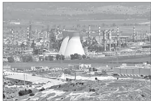
Хайфский нефтеперерабатывающий завод

Нефтеперерабатывающий завод в Хайфе, напоминает «Гаарец», неоднократно привлекал к себе внимание экологов и местных активистов, которые заявляли о его небезопасности. В 2006 году во время 34-дневной войны с движением «Хизбалла» на территорию завода залетела ракета, однако она не вы-