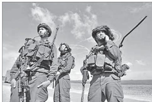
Израильские солдаты на границе с Египтом

Пока израильская армия не усиливает свое присутствие вдоль южной границы. Однако представители ЦАГАЛА говорят, что решение по этому вопросу будет принято в ближайшее время.