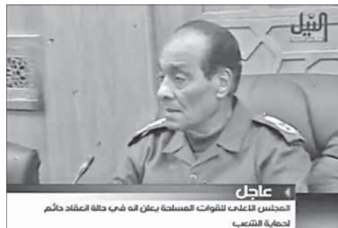
Хусейн Тантави. Кадр египетского телевидения

Израиль обеспокоен «негативными веяниями», исходящими из некоторых стран региона, и опасается, что революция в соседнем Египте может в конечном итоге привести к открытию еще одного фронта против Израиля, если в следующее египетское правительство войдут исламские экстремисты. По словам представителя спецслужб, новому начальнику Генштаба израильской армии Бени Ганцу придется сосредоточить внимание прежде всего на египетской революции и других событиях в этом регионе.