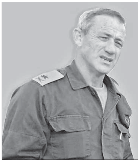
Бени Ганц, будущий глава Генштаба ЦАГАЛа

бывший командир спецназа Генштаба, глава военной разведки, начальник Генерально-