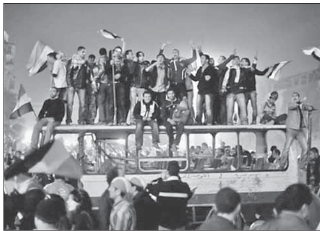
Демонстранты на площади Тахрир в Каире