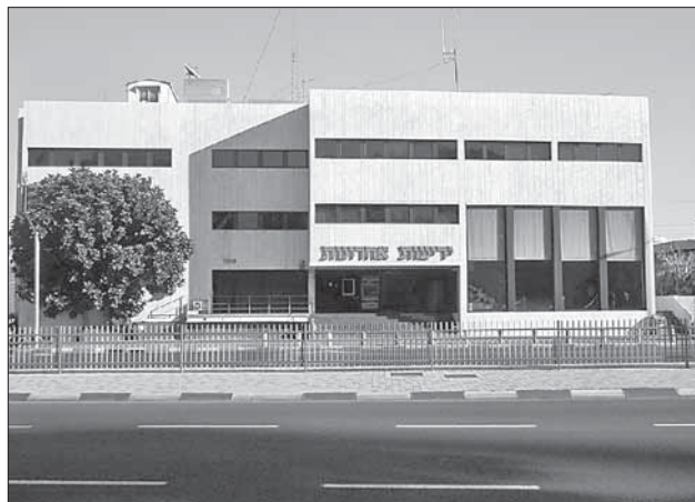
Штаб-квартира издательского дома «Едиот ахронот»

народной коалиции, в которую должны войти многие страны — например, США, НАТО, Израиль и хотя бы одно арабское государство.