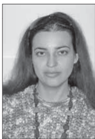
Подготовила Наталья Дегтева

«Ведомости Одесского градоначальства», 12 ноября 1911 г.