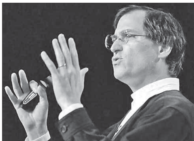
Возвращение Стива Джобса. Конференция Macworld, 1997 г.

Sun Solaris, довести до хоть какого-то завершения проект Copland (за этим кодовым названием скрывалась новая версия MacOS — System 8) или же купить кого-то из разработчиков новых ОС.