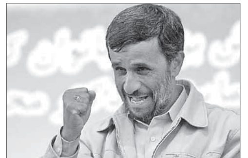
Президент Ирана Махмуд Ахмадинежад

Президент Ирана Махмуд Ахмадинежад прокомментировал сообщения о возможном нападении на его страну со стороны Израиля, сообщает агентство «Франс пресс». По его словам, Запад, США и Израиль ищут союзников и готовят нападение на Иран, опасаясь растущего влияния Тегерана в регионе.