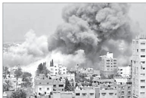
Израильский авиаудар по Газе

Последний до этого времени обмен ударами между Израилем и сектором Газа, приведший к человеческим жертвам, произошел в период 29–30 октября. Тогда погибли 12 палестинских боевиков и один мирный житель Израиля. Также израильские ВВС совершили рейд на сектор Газа в отместку за запуск отсюда ракеты 10 ноября, однако тот инцидент обошелся без жертв.