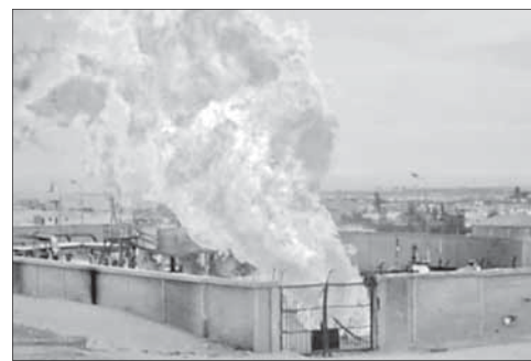
Пожар на газопроводе на Синае

Представители израильской армии заявили, что авиаудар был ответом на запуск ракеты по Изра-