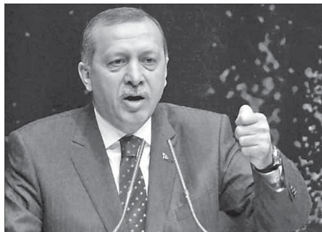
Турецкий премьер-министр Реджеп Тайип Эрдоган

циального посланника израильского руководства, в задачу которого входит попытка смягчить двусторонние отношения. Стоит добавить сюда тот факт, что турецкие ВМС не сопровождали (как обещал в свое время Эрдоган) очередную «Флотилию свободы» к берегам Газы. Все это дает право с некоторой осторожностью предположить, что в отношениях между двумя странами наметились положительные изменения.