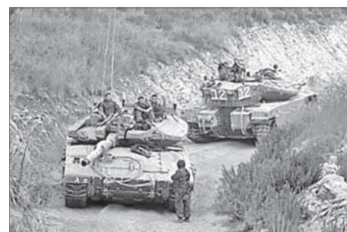
Израильские танки на ливанской границе

В этой связи израильское руководство приняло решение провести в северных районах страны учения по эвакуации мирного населения в убежища и проведению мероприятий, связанных с отражением массированной ракетной атаки — как конвенциональной, так и с