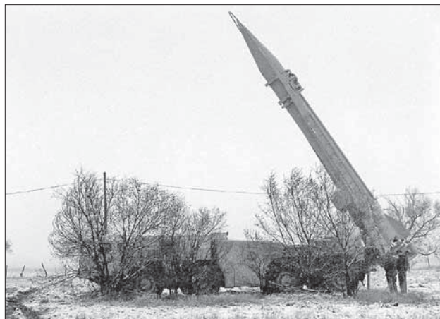
Сирийские ракеты теперь нацелены на Турцию?

турецких войск для защиты местного мирного населения. Однако для такого вторжения подходящего повода пока не находилось.