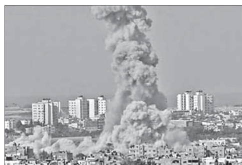
Удар израильских ВВС по сектору Газа

Премьер добавил, что еще тогда предвидел: революции станут исламскими, антизападными, антилиберальными, антиизраильскими и антидемократическими. «Ну, так кто из нас не понимал истории и реальности?» — поинтересовался Нетаниягу. Он также отметил, что революции ведут арабский мир не вперед, а назад, поэтому не могут считаться положительным явлением. Кроме того, премьер выразил озабоченность по