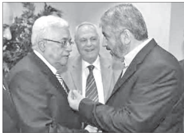
Махмуд Аббас (слева) и Халед Машаль

«Между нами больше нет разногласий. Мы договорились работать как партнеры с общей ответственностью», — сказал после