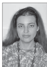
Подготовила Наталья Дегтева

«Ведомости Одесского градоначальства», 26 ноября 1911 г.