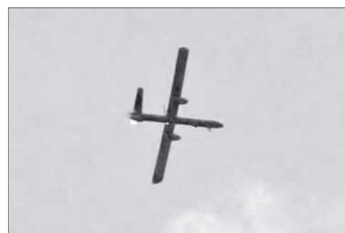
Израильский беспилотник в небе над Ливаном

В результате сильного взрыва, произошедшего днем 2 декабря на юге Ливана, как минимум два человека получили ранения, пишет бейрутская «Дейли стар». По словам некоторых очевидцев, взорвалась ракета, выпущенная с израильского беспилотника по цели между городами Срифа и Дейр-Кифа. Другие источники, однако, уверяют, что взорвалась кассетная бом-