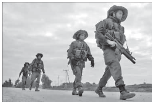
Военнослужащие ЦАГАЛа на границе с Египтом

Силы безопасности остаются в состоянии повышенной готовности после теракта, совершенного в августе 2011 года. Тогда, напомним, семеро израильтян были убиты, 31 получил ранения. Нападения произошли около шоссе, ведущего в Эйлат. ЦАГАЛ тогда развернул беспрецедентное количество войск для обеспечения безопасности в этом районе.