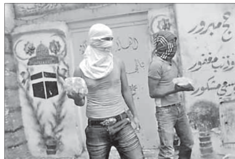
Палестинские камнететели в Иерусалиме

Сейчас ЦАГАЛ отказывается идти на подобный риск, который может обернуться новым нападением. Генерал Ганц приказал укрепить силы безопасности, раз-