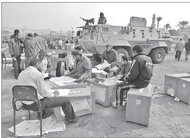
Египетская армия следит за порядком при подсчете бюллетеней

ние страны в самом начале ее демократического пути? Какова будет внешняя политика нового режима?