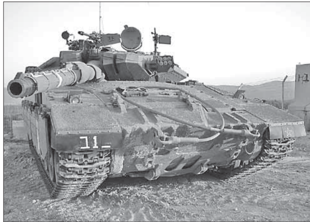
На закупку новой боевой техники для ЦАГАЛа нужны деньги...

Позиция правительства Израиля относительно планирования оборонного бюджета значительно изменилась. В октябре 2011 года Нетаниягу поддерживал мнение ряда экономистов, что