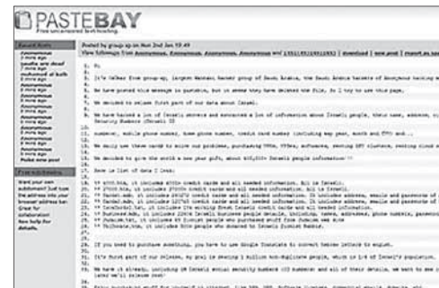
Страница сайта Pastebay с обращением хакеров

Сами хакеры утверждают, что им удалось украсть данные 400 тысяч человек, однако банки — эмитенты карт опровергают это высказывание. «Рейтер» со ссылкой на