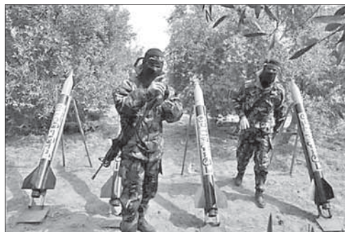
Боевики ХАМАСа готовят ракеты к запуску

Палестинцы были задержаны и переданы для допроса сотрудникам Службы общей безопасности (ШАБАК). Стоит отметить, что всем задержанным примерно по 18 лет. Пока неясно, кому они планировали передать оружие или каким образом собирались его применить.