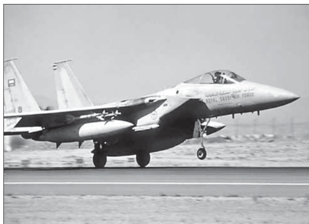
Истребитель F-15 ВВС Саудовской Аравии

дикализма. Попытки найти и ликвидировать лидеров террористических группировок не приносили успеха вплоть до мая 2011-го, когда американские коммандос, наконец, настигли вождя «Аль-Каиды» Усаму Бин-Ладена. Однако эта операция не оказала существенного влияния на рост исламского экстремизма. За десять лет он распространился на 62 мусульманские страны, хотя раньше активно действовал примерно в сорока. Джихад впервые