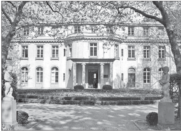
Вилла «Марлир», где проходила Ванзейская конференция

Считается, что секретная конференция в Ванзее — это важнейший поворотный пункт в истории Холокоста. На повестке дня конференции стоял ряд вопросов, главным образом технического характера, на которые должны были дать ответ представители исполнительной власти рейха.