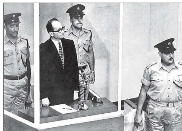
Закономерный финал: А. Эйхман в зале суда в Иерусалиме. 1961 г.

...Могут спросить: стоит ли возвращаться к этой теме снова и снова, даже спустя семь десятилетий? Вместо ответа — два факта, причем из совершенно разных стран (объединяет их, однако, то, что обе были участницами антигитлеровской коалиции). В Великобритании в предпраздничные дни некоторые книжные магазины предлагали книгу Адольфа Гитлера «Майн кампф» в качестве рождественского подарка и даже называли такой подарок «идеальным» и «самым лучшим», в ряде магазинов эта книга даже стала бестселлером рождественских продаж! А на Украине — в Кременчуге Полтавской области — 1 января около двух часов ночи неизвестные подожгли синагогу... Так что нам всем есть над чем задуматься, вспоминая Ванзейскую конференцию. ☞