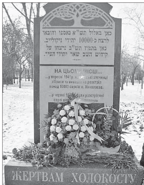
Памятник жертвам Холокоста в Николаеве

Мероприятие было тщательно продумано и прошло в высшей степени организованно. Будем надеяться, оно послужит для формирования у учащихся и студентов учебных заведений города той толерантности во взаимоотношениях наших сограждан, которую декларирует нынешнее руководство Украины.