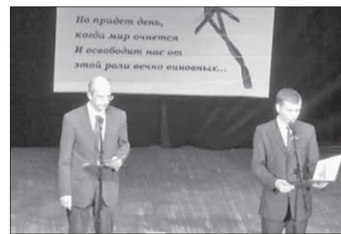
Выступает представитель консульства Греции