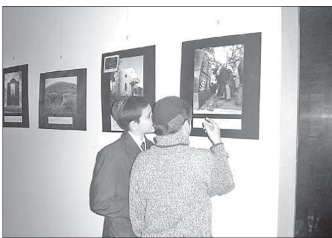
На выставке «Память в бетоне» представлены фото памятников погибшим в огне Холокоста на территории Одессы и области