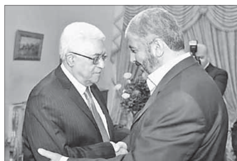
Встреча М. Аббаса (слева) и Х. Машаля в Катаре

В середине 2007 года Палестинская автономия фактически была разделена на сектор Газа, где у власти находится ХАМАС, и Западный берег, оставшийся под конт-