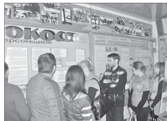
В херсонском общинном Музее Холокоста