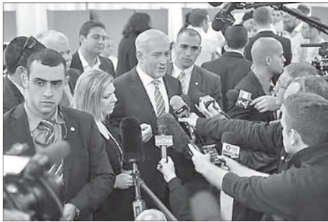
Пресс-конференция Нетаниягу по итогам выборов

В 2007 году Нетаниягу победил на внутрипартийных выборах с похожим результатом. Тогда политик получил 73,2 процента голосов, тогда как Фейглин — 23,4 процента. Фейглин является представителем праворадикального крыла партии и выступает против