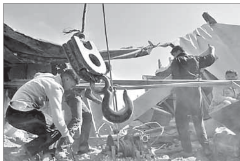
Тоннель в Газе, уничтоженный ВВС ЦАГАЛа

Удар был нанесен в ответ на обстрел Израиля ракетами «кассам». В результате воздушных атак ранены два палестинца.