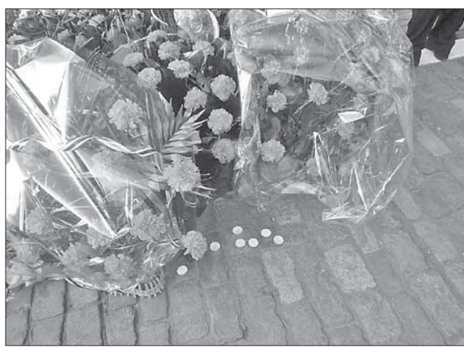
Цветы у памятного знака в Прохоровском сквере