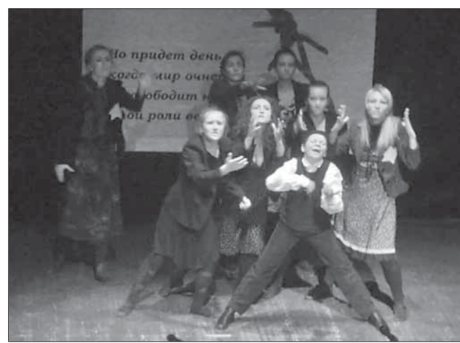
Выступают еврейские творческие коллективы