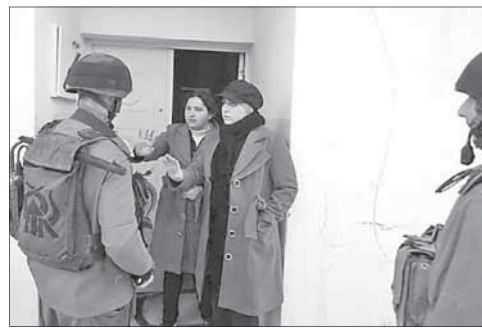
ЦАГАЛ проводит обыски в палестинской деревне

В ночь на 19 февраля силами ЦАГАЛа на территории Иудеи и Самарии были задержаны шесть разыскиваемых палестинских террористов. Все задержанные переданы