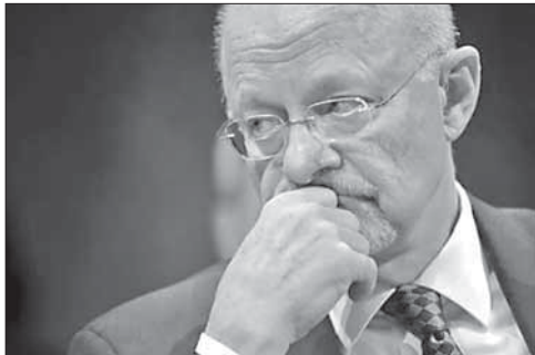
Дж. Клаппер на слушаниях в Сенате

Об официальной реакции Израиля на новый рейд пока ничего не известно.