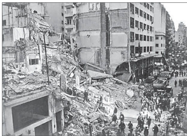
1994 год. Общинный центр в Буэнос-Айресе после взрыва

Прошло уже четыре года после ликвидации в Дамаске Имада Мугни. Изменились границы конфликта и границы возможностей. За прошедшие 20 лет, и особенно после теракта в Нью-Йорке 11 сентября 2001 года, террор и война с ним стали глобальным явлением. Спецслужбы разных стран, которые в прошлом фанатично скрывали имевшуюся в их распоряжении информацию, активно сотрудничают между собой. Технологические возможности, которыми в прошлом обладали немногие, стали чем-то само собой разумеющимся. Государственные и корпоративные интересы отошли на второй план, поскольку мир осознал, что от террора ныне не защищен никто.