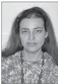
Подготовила Наталья Дегтева

«Ведомости Одесского градоначальства», 19 февраля 1912 г.