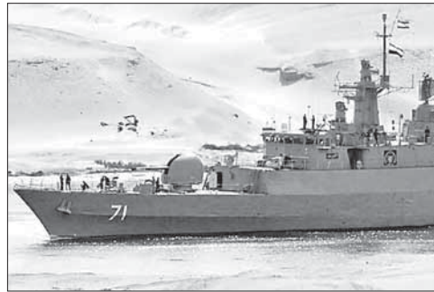
Корабль иранских ВМС в Суэцком канале

Кроме того, Джеймс Клаппер рассказал членам сенатского комитета о том, что разведслужбы США ведут наблюдение за «разветвленной сетью» складов химического оружия в Сирии, которые, по его словам, при определенных обстоятельствах будут представлять большую опасность, чем ливийские арсеналы после начала вооруженного сопротивления режиму Муаммара Каддафи. Клаппер, однако,