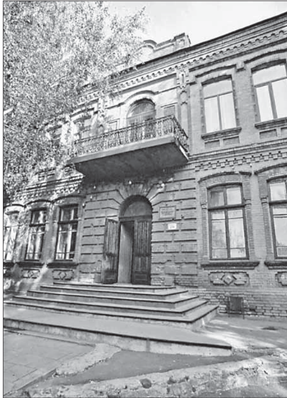
Бывшее здание талмуд-торы