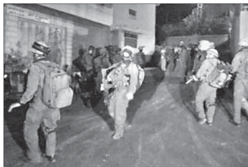
Солдаты ЦАГАЛа у офиса телекомпании «Ватан»