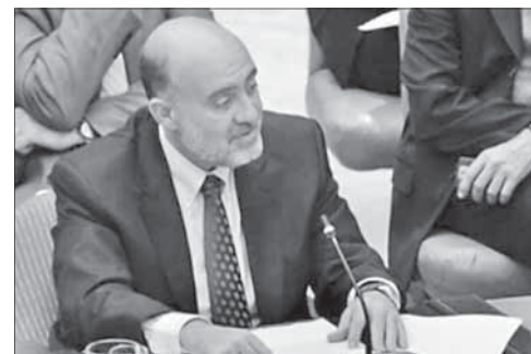
Посол Израиля в ООН Рон Прозор

Внутренняя переписка разведывательной компании Stratfor