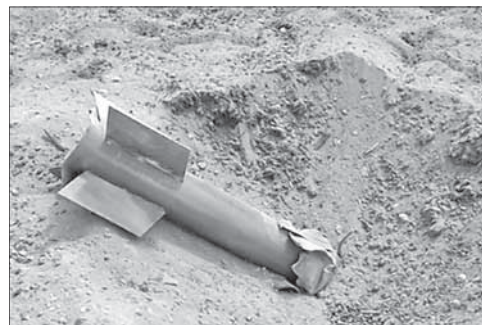
«Кассам», прилетевший из Газы

Позже системы слежения зафиксировали запуск еще одной ракеты.