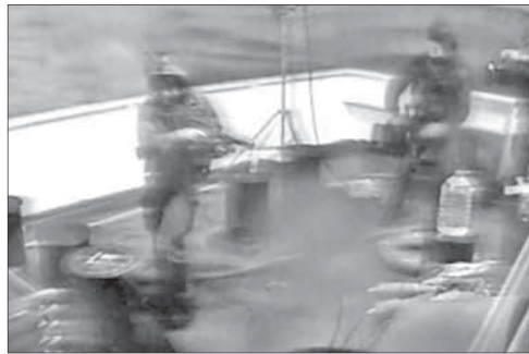
Израильские спецназовцы на борту испанского судна

Израильский морской спецназ захватил испанское (по другой информации, шедшее под флагом Либии) торговое судно в 160 км от побережья страны. Спецназ высадился на борт корабля для проверки груза, так как имелись подозрения, что корабль вез оружие в Газу.