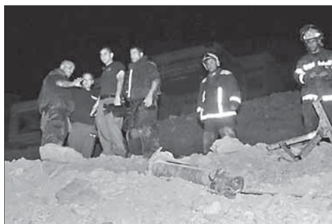
На месте падения ракеты в Эйлате

10-й канал израильского ТВ распространил информацию о том, что обстрел курорта Эйлат в начале апреля нынешнего года был осуществлен ракетами, доставленными из Ливии. Ракеты были контрабандой перевезены через Египет в Газу, а оттуда вывезены на Синай. Ракетный обстрел был осуществ-