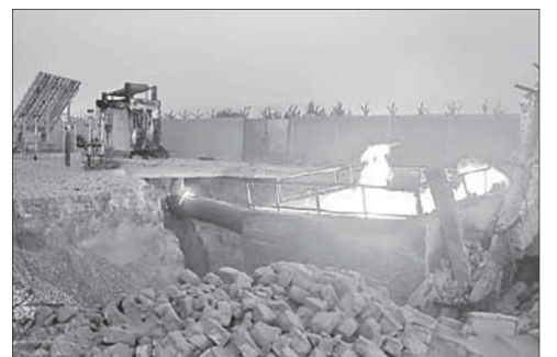
Очередной подрыв газопровода на Синае

Израиль получает 43 процента всего газа из Египта, при этом около 40 процентов электричества израильские энергетики про-