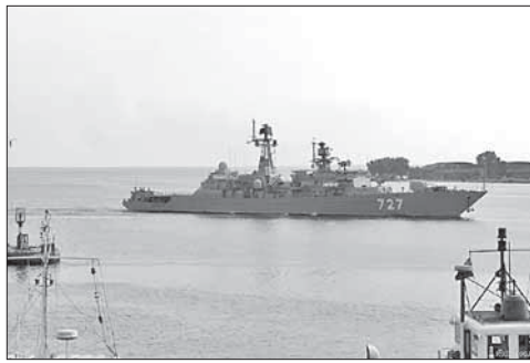
«Ярослав Мудрый» выходит из гавани Балтийска

13 декабря МИД России сообщил, что подготовил план эвакуации рос-