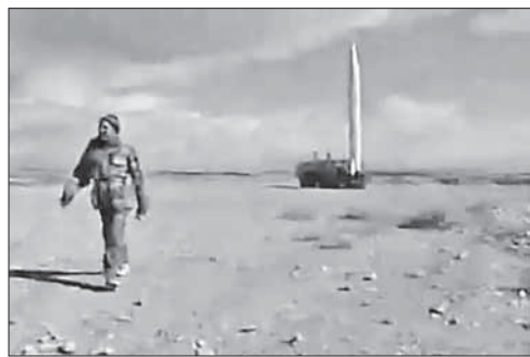
На заднем плане виден готовый к запуску «Скад»

Европейский союз ввел эмбарго на поставки иранской нефти 1 июля текущего года, а до этого аналогичные меры в отношении Тегерана приняли Соединенные Штаты. ЕС и США обвиняют Тегеран в разработке ядерного оружия, в то время как в Иране уверяют, что ядерные разработки носят исключительно мирный характер. Кроме нефтяного экспорта, США и Евросоюз ввели санкции в отношении иранских компаний и банков. В то же время, некоторые крупные покупатели иранской нефти, в том числе Китай и Турция, решили продолжать поставки из страны.