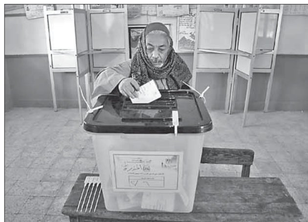
Египтянин голосует на конституционном референдуме

щенным. Оно связано с культурным противостоянием между Западом и исламом. Запад наблюдает за президентом Мурси и тем, как он пытается ввести в стране законы шариата. Понятия «диктатура» и «религиозное