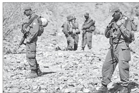
Патруль израильской армии в районе Эйлата