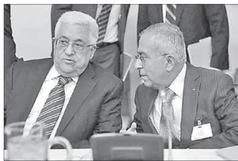
Махмуд Аббас (слева) и Салам Файяд

Аббас принял отставку премьер-министра ПА. Президент Палестинской автономии Махмуд Аббас принял отставку главы правительства Салама Файяда. При этом Аббас попросил Файяда остаться на посту премьер-министра до тех пор, пока не будет сформировано новое правительство. О том, что Файяд подал