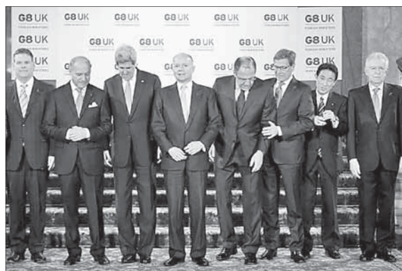
Министры иностранных дел «Большой восьмерки»

Между тем, сами руководители промышленности и оборонных ведомств Ирана недавно заявили о планах на строительство 10 новых ядерных объектов, о которых они не собираются отчитываться перед МАГАТЭ. Что касается президентских выборов, до окончания которых США вроде бы не собираются предпринимать в отношении Ирана резких шагов, то они вряд ли окажут влияние на ядерную программу. Она находится в