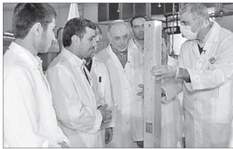
Президент Ирана Махмуд Ахмадинежад (второй слева) беседует с физиками-ядерщиками

Обама выделил деньги сирийским повстанцам. Президент США Барак Обама 12 апреля подписал распоряжение о выделении 10 миллионов долларов на поддержку сирийских повстанцев. Согласно тексту документа, выделенные средства будут направлены на закупку продовольствия и медикаментов для снабжения Свободной армии Сирии, сражающейся против правительственных войск.