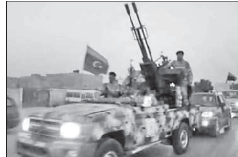
Ливийские военнослужащие на улицах Бенгази

Как заявил глава кабульской полиции, погибли все участники нападения. Двое боевиков подорвались сами,