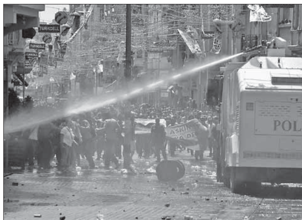
Стамбул: полиция применила против демонстрантов водометы

То, что, вне всякого сомнения, помогло Эрдогану, — это укрепление международного статуса Турции и экономический успех последних лет. Анкара больше не обращает внимания на Европейский союз, ко-