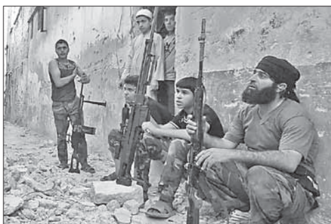
Сирийские повстанцы на КПП «Кунейтра»

У Ф. Лаутенберга остались вдова, шестеро детей и 13 внуков. Свои соболезнования семье сенатора принесли представители как демократов, так и республиканцев.