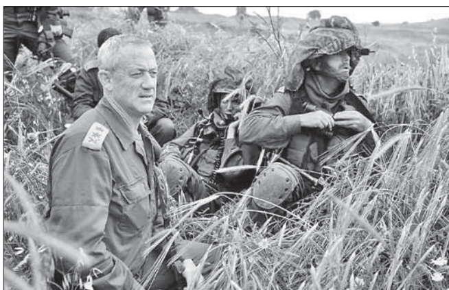
Генерал Ганц (слева) наблюдает за полевыми учениями ЦАГАЛа

Вся операционная активность резервных батальонов будет отменена до конца текущего года. В частнос-