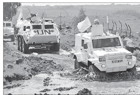
Австрийские миротворцы на Голанах

Путин нашел замену австрийским миротворцам на Голанах. Президент России Владимир Путин заявил, что российские военнослужащие могут заменить австрийских миротворцев на Голанских высотах в том случае, если ООН и «региональные державы» эту идею поддержат.