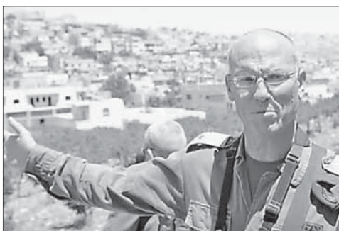
Генерал-майор Ницан Алон

По данным генерала, за последние два месяца количество атак уменьшилось на две трети (на март пришел-