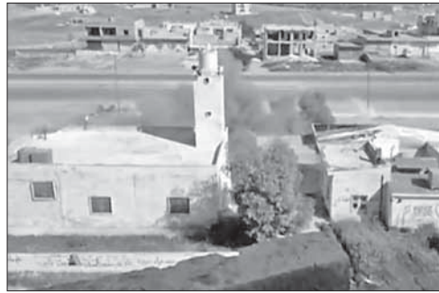
Взрыв снаряда предположительно с газом зарин

В Баварии устроили облаву на неонацистов. Более 700 сотрудников немецких правоохранительных органов провели широкомасштабную операцию против неонацистской группы «Свободная сеть юга». Полицейские вели обыски в домах и на рабочих местах предполагаемых участников объединения. В ряде случаев полиции удалось обнаружить экстремистскую литературу.