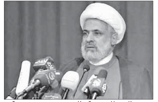
Заместитель главы «Хизбаллы» Наим Касем

«Хизбалла»: «Взрывы в Бейруте — дело рук Израиля!» Заместитель главы группировки «Хизбалла» Наим Касем заявил 12 июля, что взрывы в пригороде Бейрута являются «частью плана тех, кто помогает Израилю сорвать сопротивление». При этом он отметил, что «Хизбалла» готова к любым нападениям со стороны Запада или Израиля.