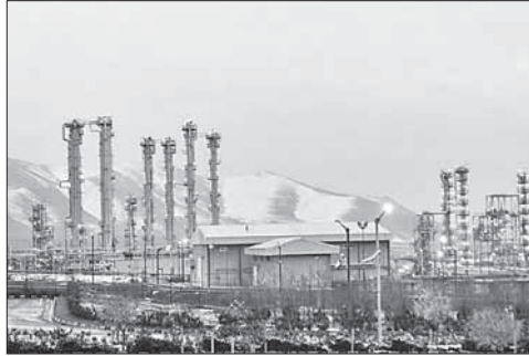
Один из иранских ядерных объектов

министрации Барака Обамы со стороны «ястребов» из Республиканской партии. Так, например, сенатор от Аризоны Джон Маккейн, известный агрессивным подходом к решению внешнеполитических проблем, в одном из своих последних выступлений заявил: «Администрация, как обычно, топчется в нерешительности и погружается в рассуждения, хотя события развиваются с пугающей скоростью. Сирия — лучший тому пример...» Однако американское руководство крайне неохотно воспринимает предложения решительно вмешаться в сирийский конфликт, утверждая, что такое вмешательство может повлечь за собой усиление по-