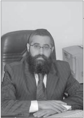
Рав Авроом Вольф, главный равин Одессы и Юга Украины

Все время, пока поезд нагужно преодолевал версту за верстой долгого пути, ребе из Слонима рабби Шмуэль Вайнберг, автор книги «Диврей Шмуэль», сидел в окружении свиты последователей, погруженный в глубокие раздумья. Но вот поезд со скрежетом остановился на какой-то станции, и в вагон поднялся еврей-арендатор ( гвир ) в сопровождении слуги. Он оглядел вагон, и взгляд его остановился на свободном месте рядом с секретарем ребе, который сидел позади него. Усевшись, гвир обратился к секретарю: «Кто этот человек, сидящий перед нами? Почему он окружен таким множеством людей?» — «Он ребе», — последовал ответ. «А я — внук ребе!» — вдруг громко заявил гвир . Услышав эти слова, рабби Шмуэль обернулся и сказал: «Если это так, то садитесь рядом со мной!» — и хасиды подвинулись, освобождая место.