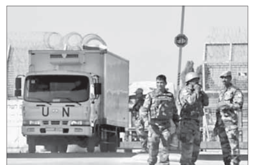
Эвакуация австрийских миротворцев

Австрия завершила вывод миротворцев с Голан. Последняя группа австрийских военнослужащих, находившихся в составе миротворческого контингента ООН на Голанских высотах, в ночь на 31 июля вернулась в Вену. Австрия приняла решение о выводе контингента с Голан