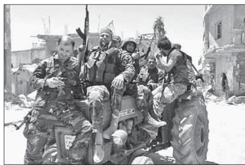
Солдаты сирийской армии на улицах Хомса

Работа 19 посольств США приостановлена на неделю. Соединенные Штаты продлили срок временной приостановки работы 19 своих посольств до 10 августа. Первоначально было объявлено о временном закрытии дипмиссий США в ряде мусульманских стран Ближнего Востока, Африки и Южной Азии до 4 августа. Такое решение, как сообщалось, было принято по соображениям безопасности из-за существующей угрозы жизни и здоровью сотрудников дипмиссий. О какой именно угрозе шла речь, не уточнялось, однако почти одновременно с сообщением о закрытии посольств Госдепартамент США предупредил американцев о возможном намерении «Аль-Каиды» в ближайшее время устроить теракт.