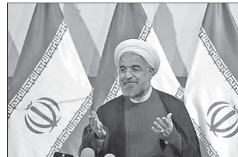
Новый президент Ирана Хасан Рухани

Санкции принимаются с целью оказать давление на власти Ирана и заставить их отказаться от атомной