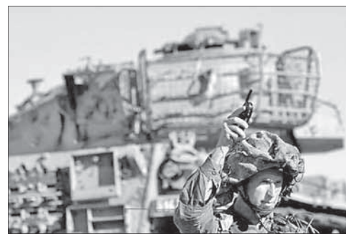
Израильский танкист на Голанских высотах

В ходе сражений между правительственными войсками и повстанцами