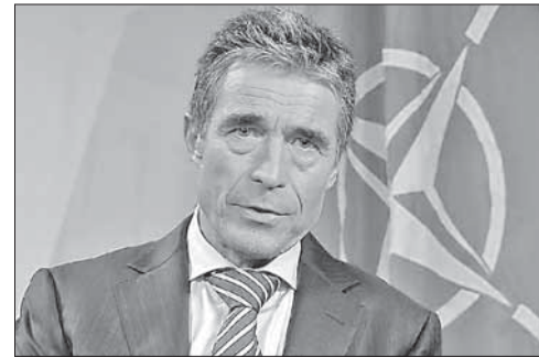
Генеральный секретарь НАТО А. Ф. Расмуссен

США объявили о резком сокращении военной помощи Египту. Госдепартамент США объявил о резком сокращении американской военной помощи Египту. По словам представителей внешнеполитичес-