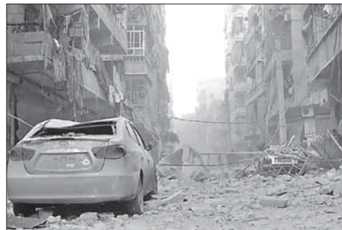
Разбомбленные дома в Алеппо

Египетские вертолеты атаковали исламистов на Синае. В результате серии ударов с воздуха, нанесенных ВВС Египта по целям на Синайском полуострове, были убиты не менее 13 боевиков-исламистов. Как рассказали представители египетского командования, в операции принимали участие ударные вертолеты «Апач», которые нанесли ракетные удары по убежищам исламистов и местам их сбора.