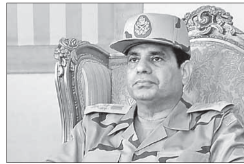
Фельдмаршал Абдель-Фаттах аль-Сиси

Это нападение на высокопоставленного чиновника стало уже вторым за последний месяц. 12 января в Сирте был убит заместитель министра про-