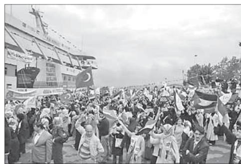
«Флотилия свободы» готовится к выходу в море