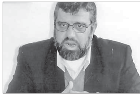
Один из лидеров ХАМАСа Хасан Юсеф

ХАМАС: «Третья интифада — не за горами!» Всего через неделю после освобождения из израильской тюрьмы один из лидеров группировки ХАМАС Хасан Юсеф заявил, что третья арабское вооруженное восстание (интифада) — это просто вопрос времени. «[Председатель Палестинской автономии] Махмуд Аббас никого не представляет, кроме себя самого, — заявил он. — ООП, ХАМАС и «Исламский джихад» выступают против переговоров с Израилем. Интифада не заставит себя ждать. Если это не произойдет сегодня, то случится завтра, если не в этом ме-