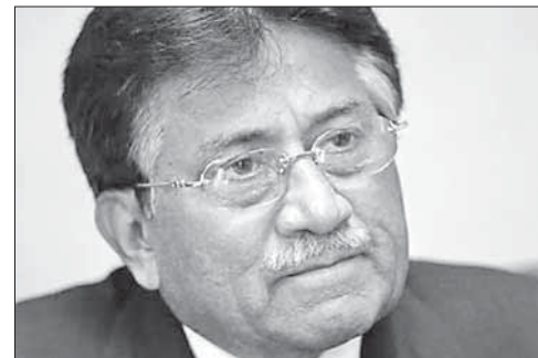
Бывший президент Пакистана П. Мушарраф

Мушарраф правил страной в 1999–2008 гг. После выхода в отставку он покинул страну, однако в 2013 году вернулся ради участия со своей партией в парламентских выборах. Новые власти страны, однако, завели