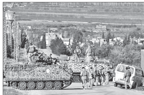
Ливанские военные на месте теракта

сторонникам, которое передал телеканал «Аль-Манар», заявил, что его движение не стремится к войне с Израилем, но продолжает оставаться в боевой готовности, так что врагам не следует недооценивать его мощь. Насралла предупредил, что впечатление о том, что «Хизбалла» слишком занята в сирийской войне и не уделяет вни-