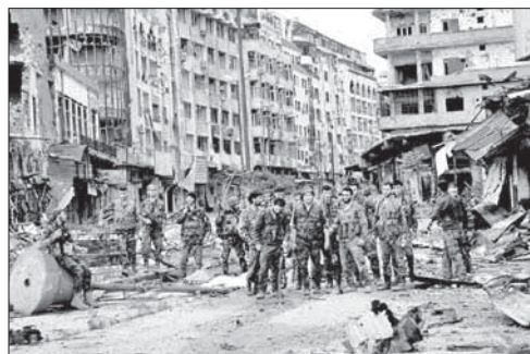
Солдаты сирийской армии на улицах Хомса

Сирийские повстанцы взорвали гостиницу в Алеппо. Сирийские повстанцы 8 мая взорвали в северном