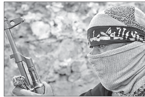
Мухаммед Саид аль-Шабвани

Тысячи людей были убиты и более миллиона человек стали вынуж-