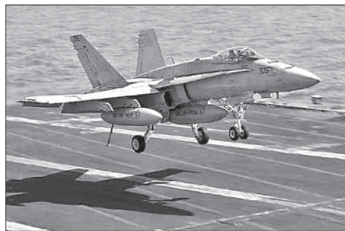
F-18 садится на авианосец «Джордж Буш»

Обострение ситуации в Ираке произошло в начале июня, когда боевики взяли под контроль северо-запад страны и, в частности, города Тикрит и Мосул. В настоящее время радикалы продвигаются к столице Ирака Багдаду.