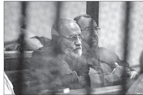
«Братья-мусульмане» в зале суда

Массовые беспорядки и нападение на полицейские участки сторонников Мурси произошли в августе 2013 года, когда новые египетские власти разогнали несколько лагерей «Братьев-мусульман», участвовавших в акциях поддержки Мурси. Его сторонники требовали восстановления полномочий бывшего президента, отстраненного от власти военными 3 июля и взятого под стражу. Ему были предъ-