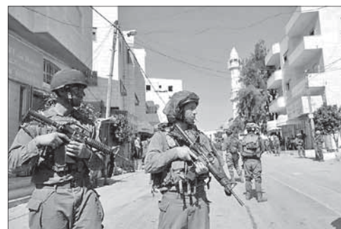
Израильские солдаты на Западном берегу

Пожалуйста, обращайтесь бережно с этим изданием — в нем приведены слова нашей святой Торы.