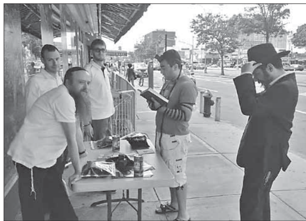
Одесситы на мивцоим в Нью-Йорке

После о́геля одесситов ждал отличный обед в шатре, а потом все поехали на мивцоим . Одесситов разделили на четыре группы, каждая получила необходимые вещи — суботные свечи, буклеты с материалами по недельной главе и рекламой общинных программ и столы, на которых все это можно было разложить. Каждая из групп стала на своем уг-