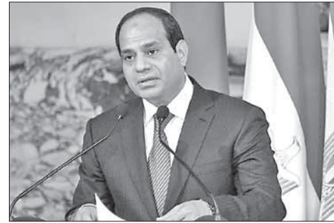
Президент Египта А. Ф. ас-Сиси

Малала с 11 лет вела на афганской версии сайта Би-би-си популярный блог, в котором резко критиковала «Талибан». 9 октября 2012 года активист движения вошел в школьный автобус и расстрелял девушку в упор.