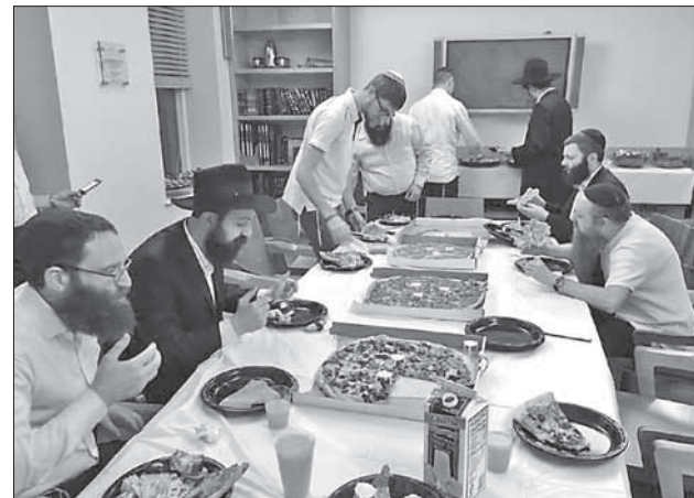
Трапеза на исходе Субботы в офисе шлухим