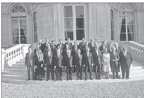
Участники парижской конференции по Ираку

Инциденты в Средиземном море с крушением лодок с нелегальными мигрантами на борту происходят практически ежемесячно. В период правления Муаммара Каддафи Ливия служила надежным заслоном на пути проникновения выходцев из африканских государств в Европу, однако теперь эффективных мер противодействия массовому наплыву нелегалов практически нет. Зачастую нелегалы, спасаясь, используют плавсредства, не выдерживают перегруза и тонут.