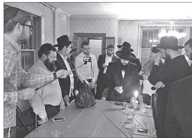
Гавдола — обряд отделения Субботы от будней