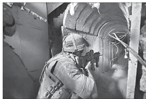
Солдат ЦАГАЛА в хамасовском туннеле в Газе

ЦАГАЛ хочет извлечь уроки из операции «Нерушимая скала». Израильские военные формируют следственные группы для изучения деятельности армии во время операции «Нерушимая скала». Всего будет создано 12 групп, каждую из которых возглавляет