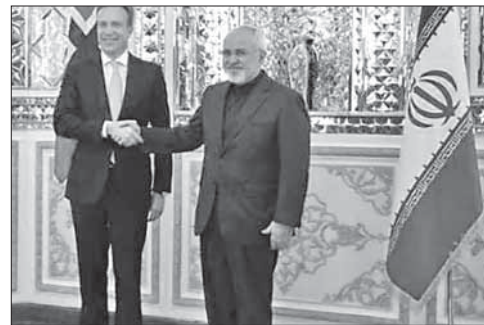
Встреча глав МИД Норвегии (слева) и Ирана

что страна примет участие в военной операции против «Исламского государства» — террористической группировки, имеющей связи с «Аль-Каидой». В начале июня ИГ захватило значительную часть территорий Сирии и Ирака. США, возглавляющие международную коалицию против исламистов, 8 августа начали военные действия в Ираке. 23 сентября американцы стали наносить авиаудары по автоколоннам, тренировочным лаге-