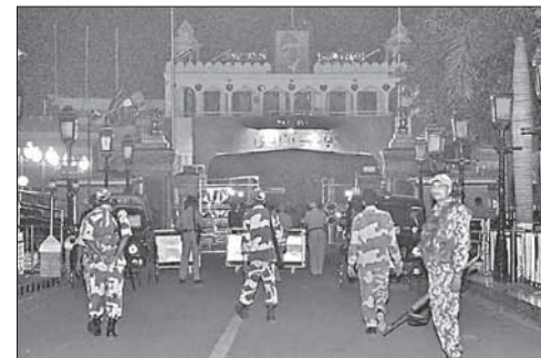
Индийские пограничники на КПП «Вагах»

При взрыве на индийско-пакистанской границе погибли 45 человек. При взрыве на индийско-пакистанской границе близ КПП «Вагах» в районе города Лахор погибли 45 человек. Еще около 70 пострадавших доставлены в больницы. Представитель