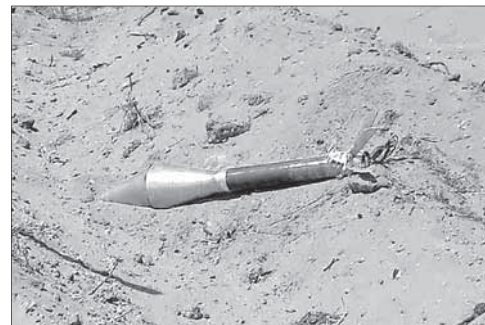
Обломки пущенной из Газы ракеты

В знак протеста Израиль принял решение отозвать посла из Швеции. Министр иностранных дел Израиля Авигдор Либерман раскритиковал решение Швеции, сказав, что «ближне-