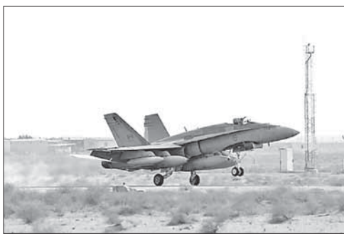
Канадский CF-18 взлетает с авиабазы в Кувейте

Сирийские курды опровергли получение помощи от Дамаска. Сирийские курды опровергли получение военной помощи от официального Дамаска. По словам одного из председателей курдской партии «Демократический союз», заявления сирийских государственных СМИ о поддержке правительством курдов в осажденном исламистами городе Кобани являются пропагандой.