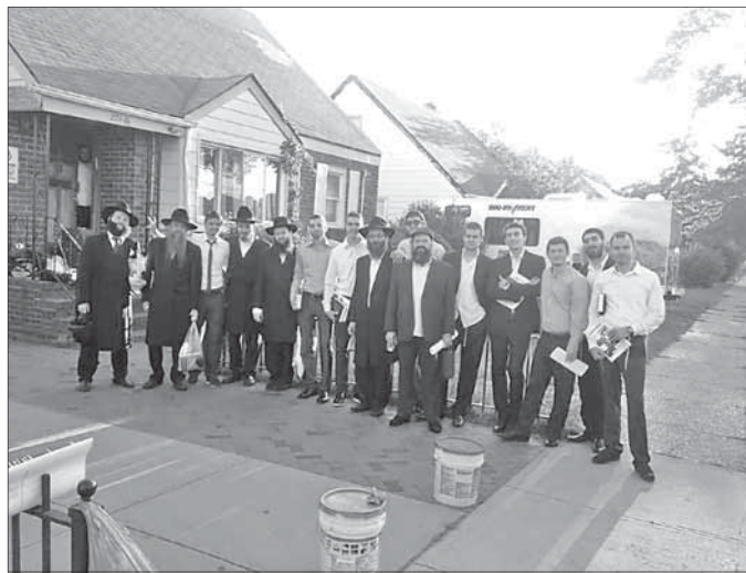
Групповое фото после последнего посещения о́еля Ребе