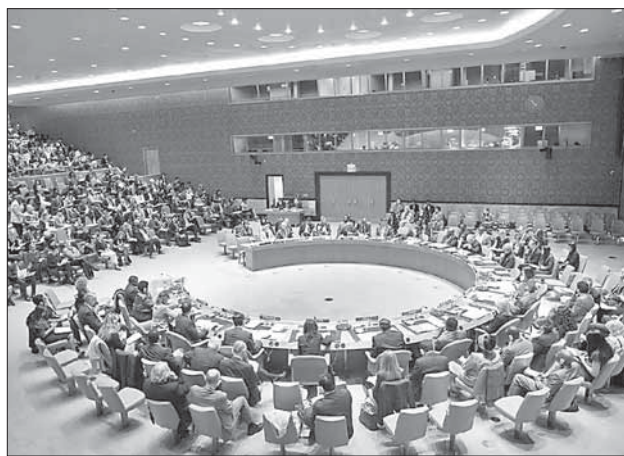
Заседание Совета безопасности ООН

Однобокое отражение событий в СМИ вызвано не только пропалестинскими настроениями левых европейских масс-медиа, но и израильским пренебрежением к информационной войне. Израиль фактически никогда не вел ее всерьез, исходя из двух противоположных точек зрения. Первая — мы правы, и это очевидно без объяснений. Вторая — в мире процветает антисемитизм, все происходящее в любом случае будет истолковано против еврейского государства, потому объяснения бесполезны. Плоды это-