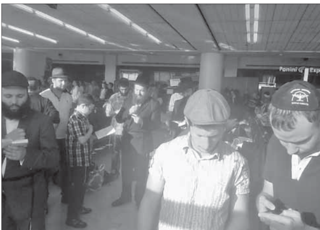
Молимся, пугая туристов, в аэропорту им. Кеннеди

Еще несколько часов, и все отправились в аэропорт и вылетели в Одессу. По прибытии быстро прошли таможенный контроль и отправились по домам. Было два часа ночи, так что первым делом все легли спать, а дальше был новый день, старая работа, веселые фарбренгены и воспоминания о поездке. Самое важное из них один из членов группы сформулировал так: «Главный итог поездки к Ребе — это то, что мы были у Ребе».