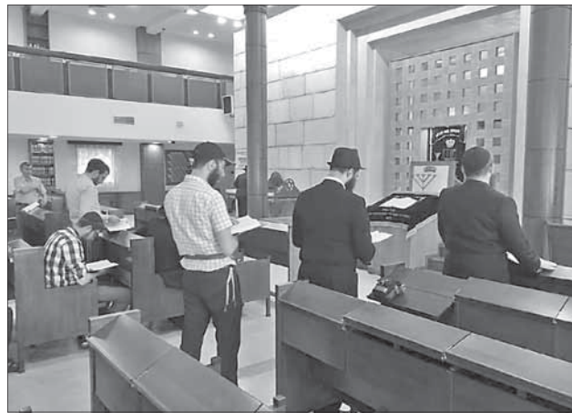
Синагога в московском общинном центре «Марьина Роща»

— Когда мы пришли, нам сразу показали 4D-фильм, который охватывает историю