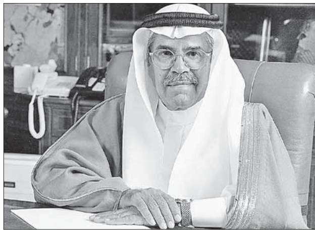
Министр нефтепромышленности Саудовской Аравии Али Наими

И вот новая сенсация: по сообщениям арабских СМИ, министр нефтепромышленности Саудовской Аравии Али Наими выразил готовность... экспортировать «черное