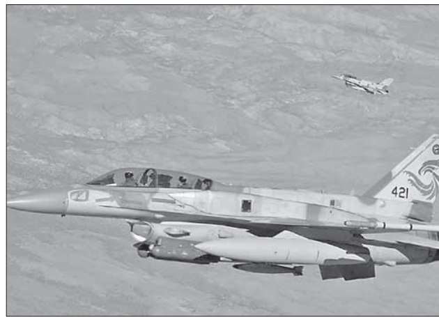
Самолеты израильских ВВС в небе над Сирией

ледних нескольких лет, действуя на ливанской территории и в долине Бекаа, общей для Ливана и Сирии. В соответствии с этими правилами, Израиль открыто заявляет о том, что