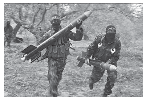
Боевики ХАМАСа готовят ракеты к запуску