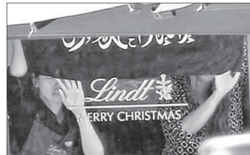
Заложники держат исламистский флаг в витрине захваченного террористами кафе в Сиднее

Один из террористов заявил, что в городе заложены четыре взрыв-