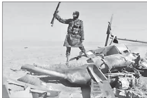
Боевик ИГ на обломках сбитого вертолета

Израиль обвиняет ПА в обстреле посольства в Афинах. Утром 12 декабря неизвестные обстреляли из автомата израильское посольство в Афинах. Никто не пострадал. Иерусалим возложил вину за выстрелы возле посольства на Палестинскую автономию и пропалестинских активистов, которые постоянно участвуют в антиизраильских подстрекательствах по всему миру.