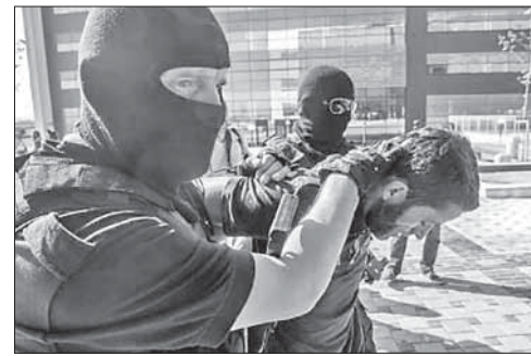
Задержание подозреваемого в связях с ИГ в Косово

В Косово заподозрили ИГ в попытках отравить воду. Власти Косово сократили подачу воды в столице края Приштине из-за угрозы отравления. Такое решение было принято после того, как полиция арестовала пять человек, подозреваемых в связях с террористической группировкой «Исламское государство», которые якобы планировали отравить систему водоснабжения. Источник в правоохранительных органах сообщил, что