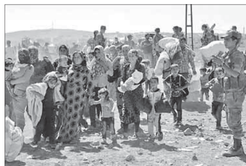
Беженцы пересекают сирийско-турецкую границу

В ООН насчитали четыре миллиона беженцев из Сирии. Число сирийцев, которые были вынуждены бежать в соседние государства, превысило четыре миллиона человек, говорится в докладе