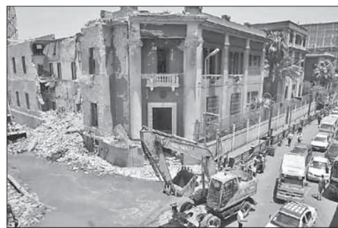
Итальянское консульство в Каире после теракта

У здания итальянского консульства в Каире взорвалась бомба. У здания итальянского консульства в Каире произошел мощный взрыв. Предположительно, взрывное устройство было заложено в автомобиле, припаркованном у стен дипмиссии. От детонации обрушилась значительная часть фасада здания.