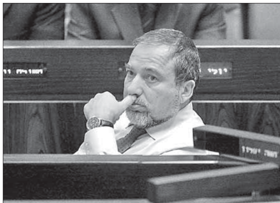
Авигод Либерман в зале заседаний Кнессета

любым способом поддерживают бойкот Израиля и израильских товаров, а также еврейских поселений. Это предложение стало реакцией на инициативу «Объединенного арабского списка» и МЕРЕЦ ввести маркировку продукции, произведенной за «зеленой чертой». А в ближайшее время межми-