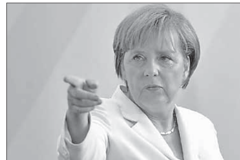
Канцлер ФРГ Ангела Меркель

По данным Управления Верховного комиссара ООН по делам беженцев, в этом году в Европу переместились свыше 500 тысяч мигрантов. ООН прогнозирует в ближайшие два года как минимум 850 тысяч пере-