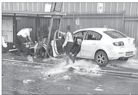
Автомобиль, врезавшийся в остановку

Террорист, получивший ранение при наезде, не смог выйти из машины и был застрелен подос-