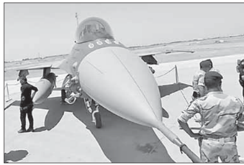
Самолет американских ВВС в Ираке

В октябре в Сирии погибли еще три иранских генерала. Отметим, что