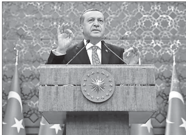
Президент Турции Эрдоган

и обличительная риторика Эрдогана, атакующего критиков внутри страны и за ее пределами, — риторика, содержащая элементы антисемитизма и антиамериканизма, — призвана скрыть растущие проблемы, но дилемма остается. Во-первых, после того, как Эрдоган годами подрывал политическое влияние