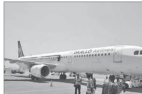
Поврежденный боевиками «Аш-Шабаб» самолет

Боевики «Аш-Шабаб» взяли ответственность за подрыв А321 в Сомали. Боевики исламистской группировки «Аш-Шабаб» взяли на себя ответственность за взрыв бомбы на борту пассажирского самолета Airbus A321 в небе над Сомали 2 февраля. В распространенном джихадистами заявлении говорит-