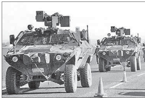
Турецкая бронетехника в районе границы с Сирией

Снайпер британского спецназа уничтожил инструктора-палача ИГ. Снайпер британского спецназа SAS с расстояния около 1200 метров уничтожил инструктора-палача