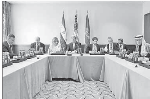
Встреча группы поддержки Сирии в Мюнхене

Участники переговоров по Сирии договорились о перемирии. По итогам встречи группы поддержки Сирии в Мюнхене согласован текст заявления. Прекращение военных действий в стране начнется в течение недели после подтверждения сирийского правительства и оппозиции. Страны договорились использовать