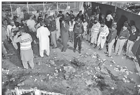
На месте взрыва в Лахоре

Теракт в Пакистане — десятки погибших. Вечером 27 марта рядом с детской площадкой в пакистанском городе Лахор произошел взрыв. Погибли не менее 70 человек, сотни пострадали — вечером на прогулку в парк, где расположена площадка, вышло множество семей с детьми. По предварительным данным, взрывное устройство привело в действие смертник.