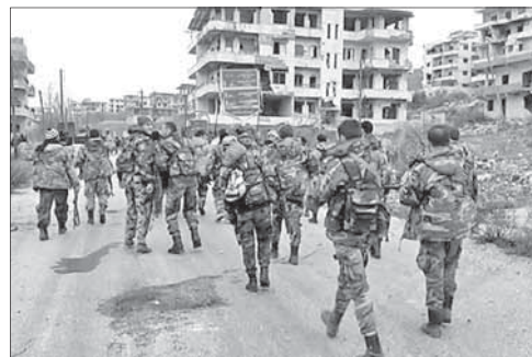
Сирийская армия входит в Пальмиру

Сирийские войска освободили Пальмиру. Сирийская армия и отряды народного ополчения полностью освободили город Пальмиру от террористов, сообщил телеканал «Аль-Маедин» со