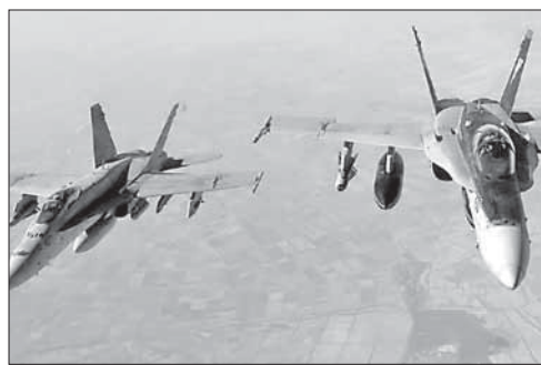
Самолеты ВВС США в небе над Ираком

В иракской армии сообщили о начале освобождения Мосула.