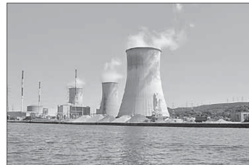
Бельгийская АЭС «Танж»

Ранее сообщалось об изъятии пропусков у 11 работников АЭС. По данным бельгийских СМИ, станция была еще одной целью брюссельских тер-