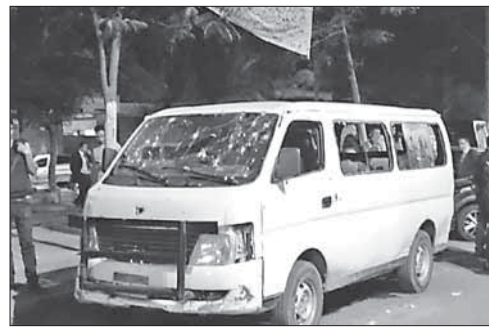
Расстрелянный полицейский микроавтобус

Исламисты прорвали оборону курдов к северу от Мосула. Боевики «Исламского государства» прорвали оборону курдского ополчения пешмерга к северу