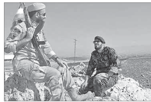
Боец КСИР (слева) и боевик «Хизбаллы» под Алеппо

По словам официального представителя КСИР, Иран понес одни из самых больших потерь в Сирии с момента развертывания в стране контингента военных специалистов. Несмотря на это, Тегеран продолжит поддержку Дамаска и будет использовать все средства для борьбы с террористами.