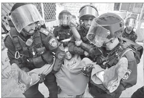
Арест подозреваемого в подготовке теракта

Пожалуйста, обращайтесь бережно с этим изданием — в нем приведены слова нашей святой Торы.