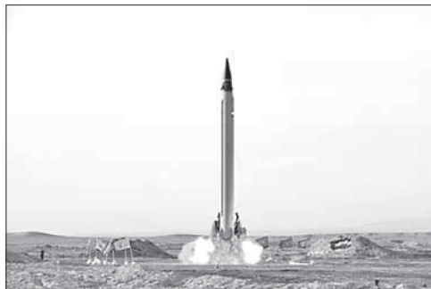
Испытания новой иранской ракеты

Обама прокомментировал операцию по ликвидации Бин-Ладена. Президент США Барак Обама выступал за проведение сек-