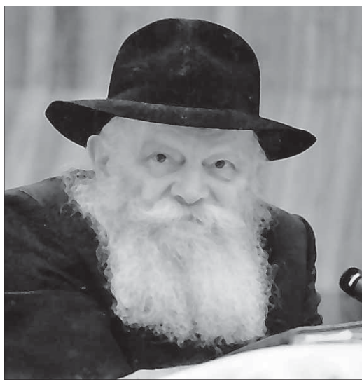
В нашей главе говорится о запрете орла: плоды недавно посаженного дерева три года запрещены еврею в пищу.

ПОМНИТЕ, что лучше вообще не зажечь свечи, чем зажечь их после наступления Субботы (Суббота наступает через 18 мин после времени, указанного в таблице).