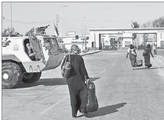
КПП «Рафиях» на границе Египта и сектора Газа

друга во всех грехах. Есть больше шансов на то, что в Израиле будет создано правительство национального единства, чем на