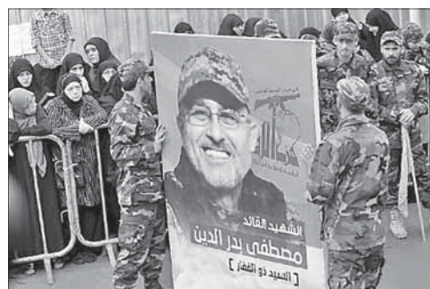
Похороны Мустафы Бадреддина

В терактах в Сирии погибли более 100 человек. Число погибших в результате серии взрывов, произошедших 23 мая в сирийских городах Джебла и Тар-