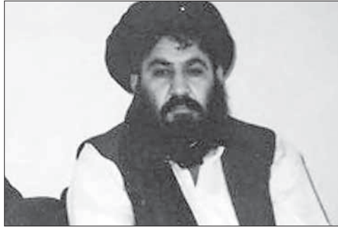
Мулла Ахтар Мансур

Ликвидирован главарь «Талибана». Высокопоставленный командир «Талибана» подтвердил информацию о гибели в результате американского авиаудара главаря движения