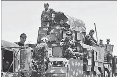
Иракские войска перебрасываются под Фаллуджу

Иракский премьер анонсировал операцию по освобождению Фаллуджи. Премьер-министр Ирака Хайдер Абади объявил о начале военной операции по освобождению города Фаллуджа, занятого террорис-