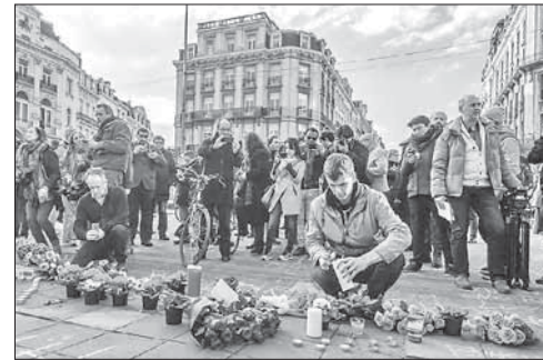
Траурная церемония на месте теракта в Брюсселе

ное послание Мухаммеда Абрини — главного подозреваемого по делу о терактах в Брюсселе. Сообщается, что документ нашли во время анализа содержимого компьютера, который террорист выкинул в мусорное ведро. Согласно тексту, Абрини планировал сам стать «мучеником», но был задержан правоохранительными органами 8 апреля. Его обвиняют в участии в деятельности террористичес-