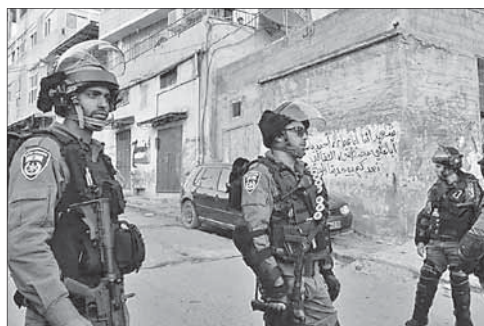
Полицейский патруль в Восточном Иерусалиме

В Иерусалиме предотвращен теракт. Нападение террориста было предотвращено вечером 19 мая в Иерусалиме. Полиция совместно с сотрудниками пограничной службы во время патрулирования вдоль линии трамвая в районе Шуафат (Восточный Иерусалим) остановила араба, который пытался сесть на автобус. При его обыске был обнаружен