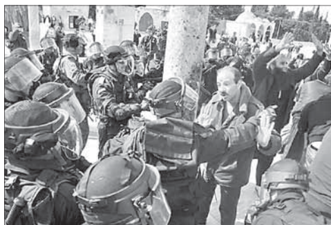
Полиция пытается утихомирить толпу в Иерусалиме

Что именно спровоцировало беспорядки, пока не ясно, однако известно, что 25 февраля палестинцы отмечают годовщину «резни в Хевроне» — событий 1994 года, когда израильтянин Барух Гольдштейн открыл огонь по палестинцам, молившимся в «Мечети Ибрагима». Тогда были убиты 29 человек, еще 125 получили ранения. Еще 19 палестинцев погибли от рук израильских военных, которые усмиряли протесты, начавшиеся на всех оккупированных территориях. Практически каждый год в этот день палестинцы выходят на поминальные