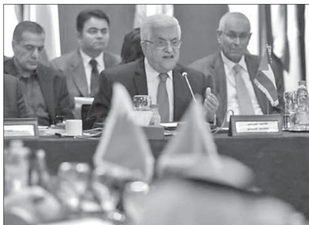
Выступление Махмуда Аббаса в Каире

цы» действует на всех магически. Люди, которых так называют, всегда вызывают горячее сочувствие и желание вернуть их на родную землю. Вряд ли кто-то всерьез будет разбираться, кому на самом деле принадлежит земля. Впрочем, сам Аббас до сих пор пользовался этой темой лишь для того, чтобы сделать Израиль более уступчивым к другим требованиям и добиться от стран-спонсоров дополнительного финансирования для устройства «беженцев». Сейчас о них вновь вспомнили, чтобы убедительнее