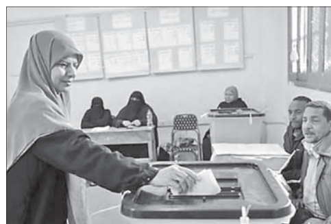
Голосование в ходе египетских выборов

Исламские партии одержали победу на выборах в верхнюю палату парламента Египта. Как сообщает агентство «Франс пресс», итоги голосования египетский избирком подвел 25 февраля. Умеренная исламистская «Партия свободы и справедливости», представляющая движение «Братья-мусульмане», по итогам прошедшего голосования получила 105 мест, в то время как ультраконсервативной салафитской партии «Нур» достались 45 мандатов. Либералы «Вафд» получили 14 кресел, а умеренный Египетский блок — восемь.