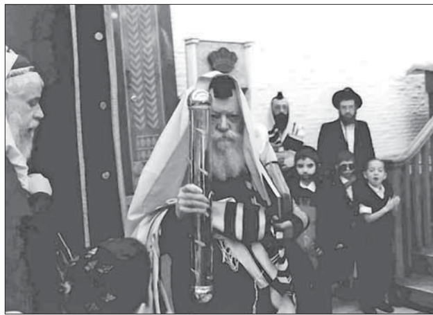
Любавичский Ребе со Свитком Эстер в руках

сителем хаюс , приходящей от Всевышнего жизненной силы в ее первозданном виде. С этой тонкой и чистой энергией сердца свя-