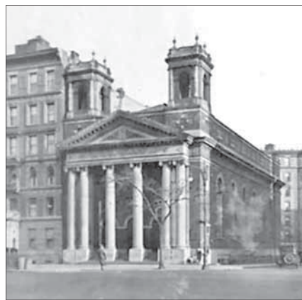
Синагога «Аншей хесед». Фото 1920-х годов

зать, уже «американского производства». Здание «Альянса», президентом которого Штраус был со дня основания в 1893 году вплоть до своей смерти, располагалось на Восточном Бродвее, в одном из перенаселенных ист-сайдских жилых кварталов.