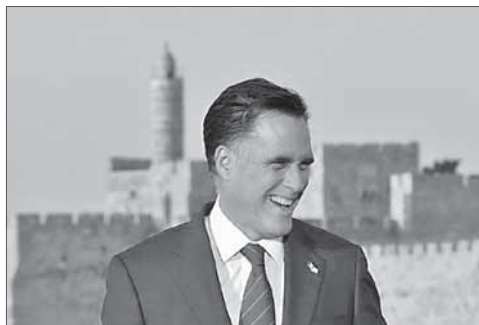
Митт Ромни в Иерусалиме

Премьер-министр Израиля Биньямин Нетаниягу объявил, что его правительство начало обсуждение плана действий на случай смены сирийского режима, сообщает агентство «Ассошиэйтед пресс». По словам Нетаниягу, его правительству «придется действовать» для недопущения попадания запасов сирийского химического оружия в руки экстремистов.