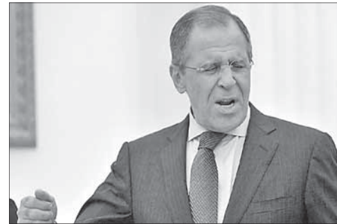
Министр иностранных дел РФ С. Лавров

Министр иностранных дел РФ Сергей Лавров заявил, что Россия не планирует предоставлять убежище президенту Сирии Башару Асаду, если тот решит отречься от власти и покинуть страну. «Все те, кто пытаются заронить эту мысль в умы международного сообщества, делают это с нечистоплотными целями. Мы не являемся и не были ближайшими друзьями сирийского режима. Ближайшие друзья у него в Европе, и если кто-то хочет решить эту проблему таким путем, то пусть думают о своих возможностях», — заявил Лавров. Слова министра передает информационное агентство «Интерфакс». Лавров также отметил, что вопрос об убежище для Асада собеседники задавали президенту РФ