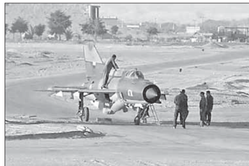
Сирийский «МиГ» на турецком аэродроме

Пилот ВВС Сирии угнал самолет в Турцию. Один из пилотов ВВС Сирии угнал свой истребитель в Турцию. Как сообщил в прямом эфире телеканал «Аль-Джазира», самолет «МиГ»