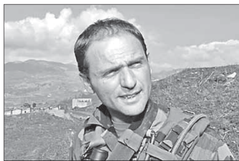
Полковник Янив Альалуф

«Аль-Джазира» купила американский кабельный канал. Катарская новостная телекомпания «Аль-Джазира» достигла договоренности о приобретении американского кабельного канала Current TV. Условия сделки не раскрываются. Current TV можно принимать примерно в 60 миллионах домов в США из 100 миллионов, где установлено кабельное или спутниковое телевидение.