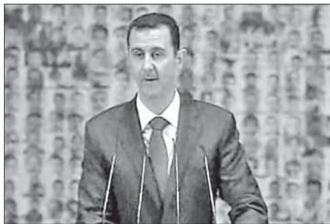
Башар Асад на сцене дамасской оперы

Башар Асад представил свои предложения по мирному урегулированию ситуации в Сирии во время выступления в дамасском оперном театре. Речь