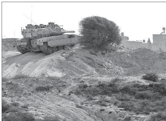
Израильский танк на позиции на границе с Сирией

к старой формуле в принципиально новых условиях — в то время, как вооруженные салафиты ведут бои вблизи от израильской границы на Голанском плато.