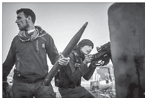
Сирийские повстанцы в бою

В США и Израиле «Хизбалла» считается террористической организацией. Ранее две эти страны уже возложили ответственность за теракт на ливанских радикалов и стоящий за ними Иран.