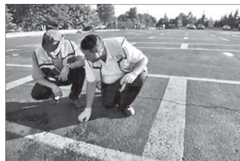
Израильские эксперты на месте взрыва в Бургасе

Болгария обвинила «Хизбаллу» в организации теракта в Бургасе. Министерство внутренних дел Болгарии официально огласило итоги расследования теракта в аэропорту города Бургас, в котором полгода назад погибли пять израильских туристов, водитель их автобуса