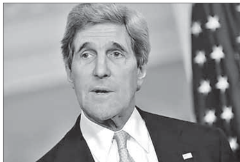
Госсекретарь США Джон Керри

Госсекретарь США призвал Иран «принять правильное решение». Госсекретарь США Джон Керри 8 февраля во время своей первой пресс-конференции на новом посту призвал Иран «принять правильное решение» по ядерной программе. Об этом сообщает агентство «Франс пресс». По словам Керри, дальнейшее развитие отношений между западными странами и Ираном целиком зависит от того выбора, который сделают в Тегеране. Если