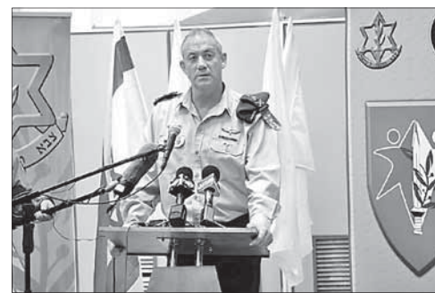
Начальник Генштаба ЦАГАЛа генерал Бенни Ганц

Пожалуйста, обращайтесь бережно с этим изданием — в нем приведены слова нашей святой Торы.