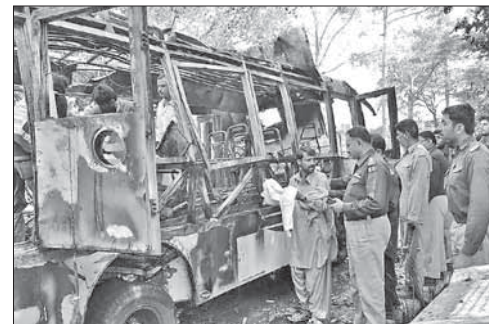
Пакистанские полицейские у взорванного автобуса

Вскоре после взрыва в автобусе было приведено в действие еще одно взрывное устройство, заложенное в местной больнице, куда поступили пострадавшие студентки. Взрыв в больнице сопровождался стрельбой — боевики захватили часть госпиталя и