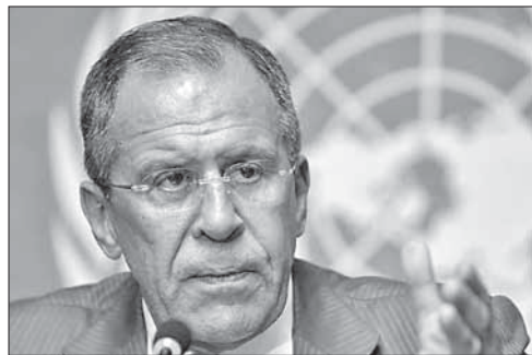
Министр иностранных дел России С. Лавров

В ходе опроса также задавали вопрос, как выход из Иудеи и Самарии повлияет на ситуацию с безопасностью в Израиле. 68% израильтян убеждены, что это несомненно нанесет ущерб безопасности Израиля, и лишь 21% считает, что это улучшит ситуацию в стране.