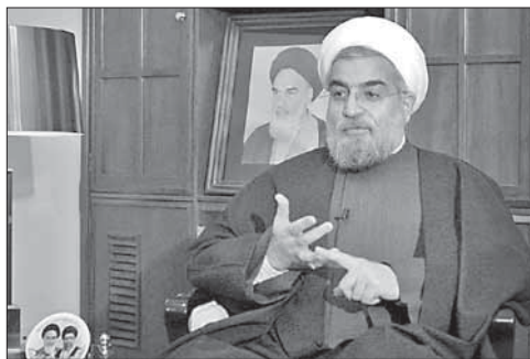
Избранный президент Ирана Хасан Рухани

В результате взрывов в Ираке погибли более 20 человек. В Ираке в результате серии взрывов погибли более 20 человек, еще несколько десятков получили ранения. Три машины, начиненные взрывчаткой, взорвались у рынков в провинции Дияла, еще одна — в пригороде Багдада. Местные власти возлагают ответственность за теракты местной ячейке «Аль-Каиды».