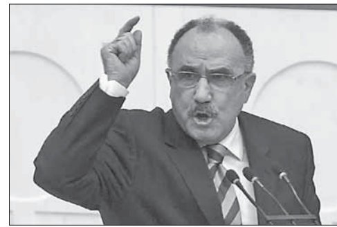
Турецкий вице-премьер Бешир Аталая

Ранее турецкие СМИ распространили заявления Аталая, которые были записаны на видео. В них вице-премьер обвинил иностранные силы и еврейскую диаспору в организации массовых