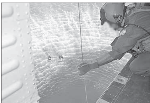
Подготовка к подъему катапультировавшихся пилотов

В Газе разбился израильский F-16. Истребитель ВВС ЦАГАЛа F-16 упал в море напротив Газы. Причиной авиакатастрофы стала неполадка двигателя. Оба пилота катапультировались и были спасены спасателями из «Отряда 669». Они не пострадали.