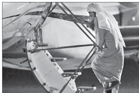
Абу-Катада поднимается по трапу самолета

Массовые протесты в Турции начались в конце мая 2013 года с демонстраций жителей Стамбула против застройки парка Гези и площади Таксим. Затем выступления перекинулись на многие другие турецкие города, включая Анкару. Общее число их участников оценивается в два миллиона человек. Протесты приобрели антиправительственный характер, а их участники выступают против проводимой Эрдоганом политики, на их взгляд, направленной на исламизацию страны. В некоторых случаях акции вылились в беспорядки, в результате которых погибло несколько человек и более семи тысяч получили ранения.