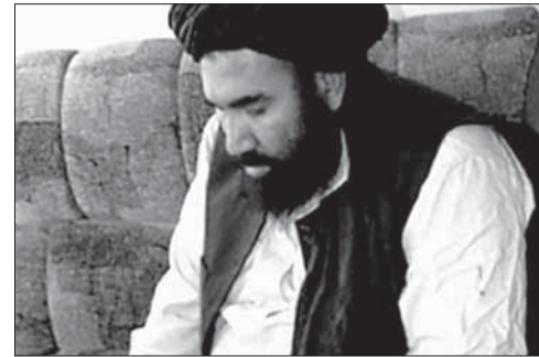
Абдулла Гани Барадар

Барадар родился в 1968 году на юге Афганистана. В 1980-х воевал против советских войск, в 1994 году помог Мухаммеду Омару основать «Талибан». Как отмечают СМИ, наибольшее влияние в движении он получил после вторжения армии США в Афганистан в 2001 году, когда предложил талибам воевать с американцами не в открытом бою, а партизанскими мето-