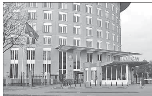
Здание штаб-квартиры Организации по запрещению химического оружия в Гааге

Сирия стала последней по времени страной, подписавшей конвенцию о всеобъемлющем запрещении хими-