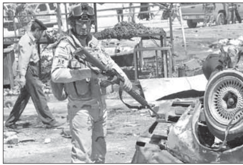
Полиция и военные на месте взрыва в Багдаде

В Багдаде произошли три взрыва. В столице Ирака 21 сентября в результате трех последовательных взрывов погибли не менее 50 человек, еще 60 получили ранения. Сначала рядом с