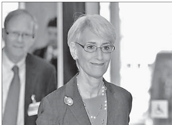
Венди Шерман прибыла на встречу с Биньямином Нетаниягу

Посол США в Израиле Дэн Шапиро на ассамблее Еврейских федераций Северной Америки также постарался усмирить стра-