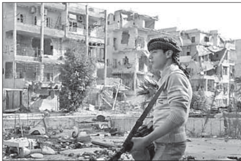
Взорванное здание под Дамаском