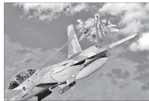
Истребители F-15 израильских ВВС

Пожалуйста, обращайтесь бережно с этим изданием — в нем приведены слова нашей святой Торы.