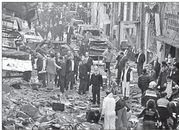
Разрушенная взрывом синагога «Неве Шалом» в Стамбуле

После 11 сентября 2001 года теракты, направленные против еврейских объ-