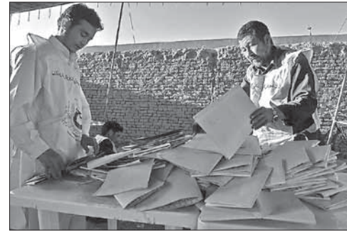
Подсчет голосов на выборах в Афганистане

Пакистанские ВВС уничтожили 150 боевиков. Истребители ВВС Пакистана в ночь на 15 июня нанесли в