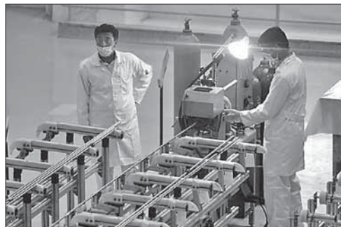
Предприятие по обогащению урана в Иране

Вскоре женщина была задержана французской полицией. Стало известно, что нападавшая страдает заболеваниями психики. По данным полиции, конфликт между пассажирами разгорелся из-за сидячего места.