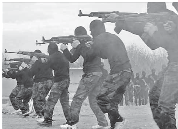
Боевики ИГИЛ в Ираке

Если ИГИЛ удастся разделить на три части Ирак, призванный сыграть роль э-