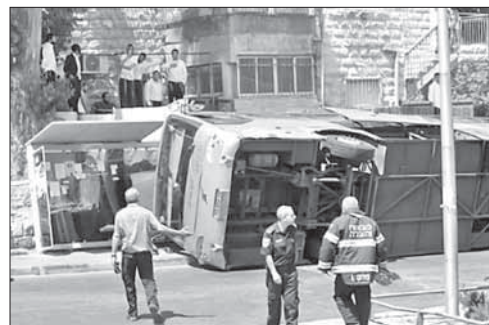
Перевернутый террористом автобус

«Бульдозерный» теракт в Иерусалиме. Утром 4 августа в Иерусалиме арабский водитель экскаватора протаранил легковой автомобиль и перевернул автобус. Один человек погиб, пятеро ранены. Террорист был застрелен находившимся поблизости полицейским.