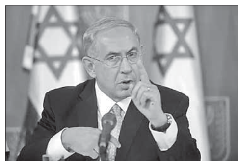
Премьер-министр Израиля Биньямин Нетаниягу

Пожалуйста, обращайтесь бережно с этим изданием — в нем приведены слова нашей святой Торы.