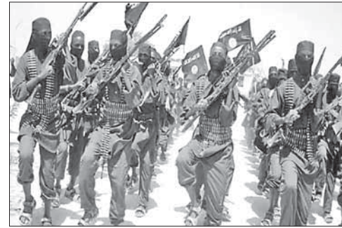
Ливийские исламисты в Бенгази

В Вуппертале синагогу забросали «коктейлями Молотова». Трое молодых людей метнули несколько бутылок с зажигательной