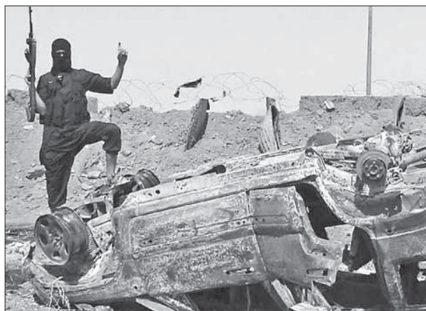
Ирак: боевик ИГИЛ у подбитого армейского автомобиля

Еще одна новая тенденция — разделение региона на два лагеря не по традиционному