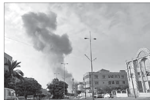
Удар израильских ВВС по Газе

Египетская пресса сообщает о нарастающей активности ИГИЛ в Газе и на Синайском полуострове. Два месяца назад силы безопасности Египта арестовали 15 членов ИГИЛ, проникших на Синай по тоннелям из Газы. Их целью было присоединиться к вооруженным группам, ведущим войну против египетской армии.