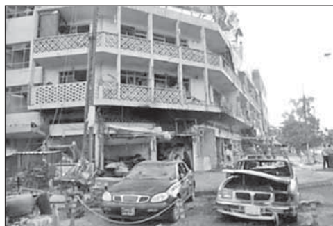
Взорванное здание в иракском городе Рамади

Многотысячные акции протеста начались в Пакистане в середине ав-