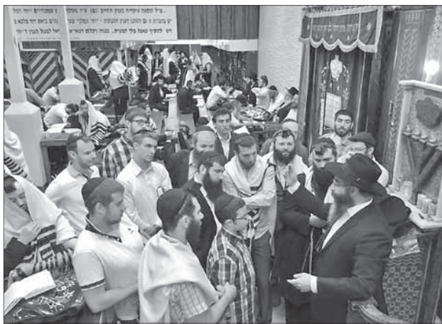
Одесская группа в молельном зале «Севен севенти»

— К нашей радости, мы очень быстро сами нашли «Севен севенти». Это оказалось всего в паре кварталов от нашего дома.