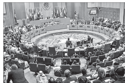
Встреча глав МИД стран — членов ЛАГ

Дипломатические источники сообщили, что первоначально министры были настроены поддержать военную кампанию США против «Исламского государства», однако в окончательном варианте текста резолюции ЛАГ прямого одобрения