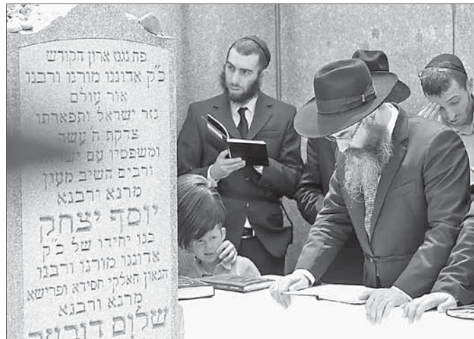
Молитва на оѓеле Любавичских Ребе

В связи с огромным количеством приехавших хасидов, нужно было действовать буквально по секундам и очень слаженно. Поэтому сначала все вместе написали пан , потом организованной группой зашли на оѓель , прочитали молитву по специально привезенным к этому случаю молитвенникам и так же вместе вышли. Жара в этот день на оѓеле была невероятная, но из-за святости места ее практически никто не почувствовал, несмотря на часовую молитву. Рав Вольф помимо своего личного пана зачитывал записки одесситов, которые ему передали перед поездкой. На этот момент оѓель посетили более двух тысяч че-