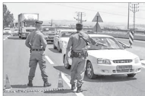
Военнослужащие ЦАГАЛа на блокпосту

Палестинца застрелили при попытке прорыва через блокпост. Палестинский водитель, пытавшийся незаконно ввезти на террито-