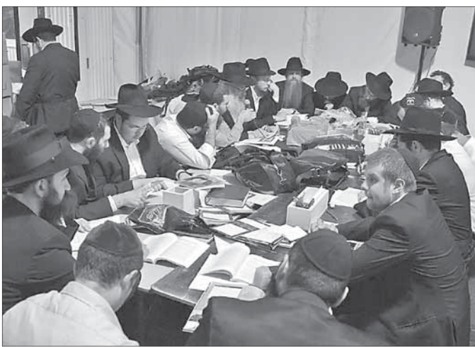
Урок в шатре — подготовка перед тем, как идти на оѓель