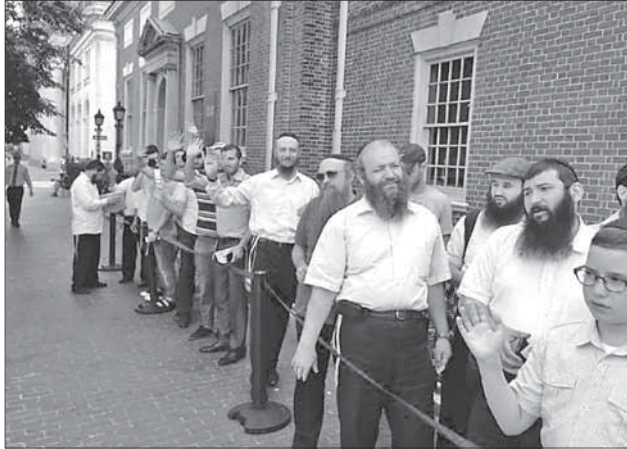
Очереди в американские музеи — почти как в советские магазины!