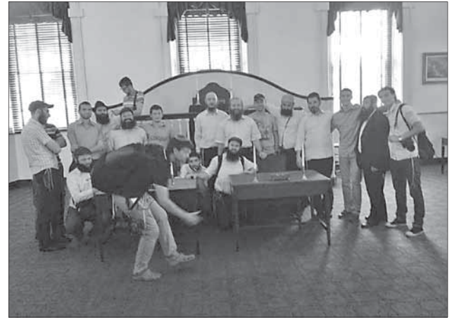
Зал, где подписывали Декларацию независимости

Система безопасности во всех музеях — как в аэропортах: тщательные досмотры, исключения не делается даже для экскурсовода. Переход из помещения в помещения осуществлялся через улицу, стоишь, ждешь, пока в проходной музей пустят, а тут одесское счастье — только зашли в первый зал, сработала пожарная сигнализация. Мы дума-