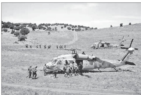
Солдаты ЦАГАЛа в районе границы с Ливаном

Пожалуйста, обращайтесь бережно с этим изданием — в нем приведены слова нашей святой Торы.