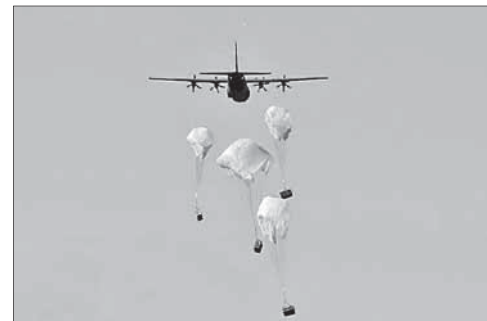
Самолеты ВВС США сбрасывают груз для курдов

Напомним, что террористическая группировка «Исламское государство» в начале июня захватила значительную часть территорий Сирии и Ирака. США, возглавляющие международную коалицию против исламистов, 8 августа начали военные действия против экстремистов в Ираке. 23 сентября США стали наносить авиаудары по