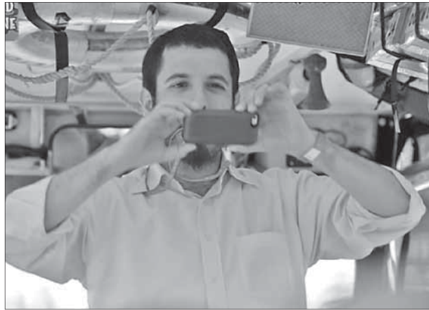
Где еще фотографируешь столько евреев с «крякалками»?

ли, что это специально, но всем пришлось вновь выйти на жару.