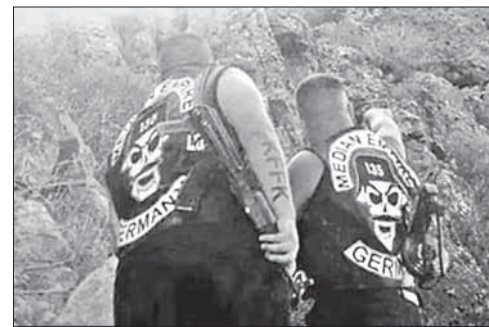
Немецкие байкеры в районе города Кобани

В то же время появилась информация о том, что в Нидерландах прокуратура одобрила действия байкеров, присоединившихся к воюющим против боевиков ИГ курдским повстанцам, хотя раньше подданным королевства было запрещено принимать участие в боевых действиях в составе армий других государств.