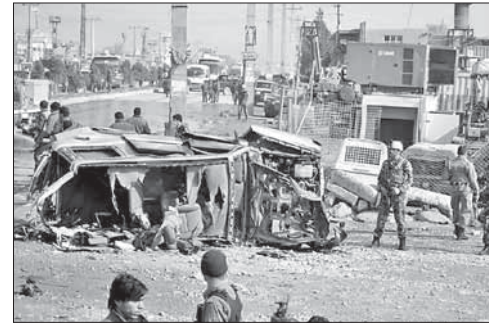
На месте взрыва в Кабуле

В полиции считают, что теракт организовала исламистская группировка «Боко харам», которая выступает за введение шариата на всей территории страны и борьбу с западным влияни-