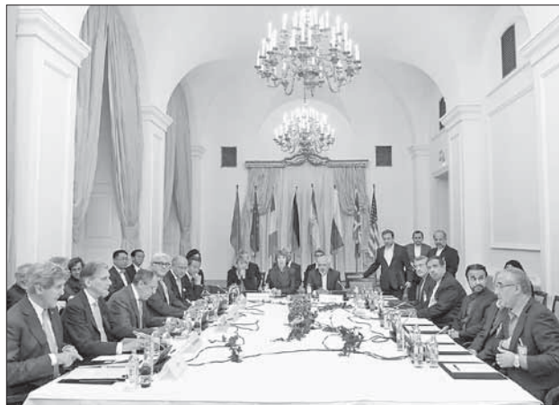
Переговоры по иранской ядерной программе

Продленный переговорный период с «временными» послаблениями дает Ирану возможность оздоровить свою экономику, не прекращая ядерные разработки. Смягчение санкций