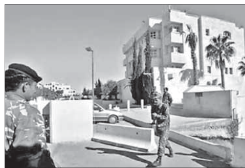
Здание посольства Израиля в Аммане

Израиль возмутила поддержка террористов Иорданией. Посольство Израиля в Аммане обратилось в МИД Иордании с письмом возмущения и осуждения поддержки, которую